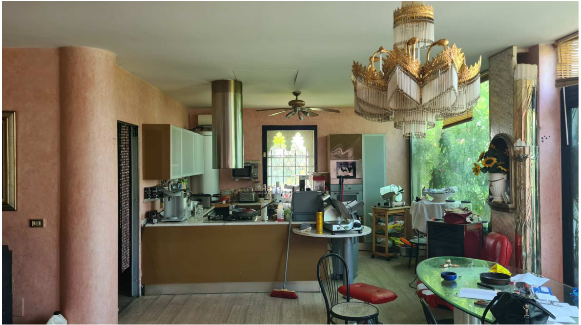
CUCINA - PRANZO