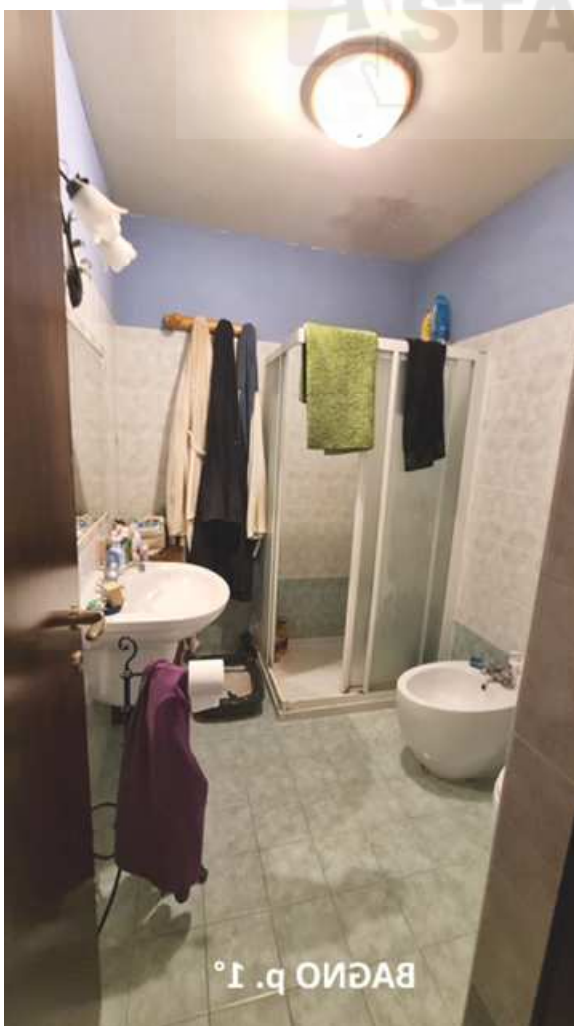
BAGNO p. 1°