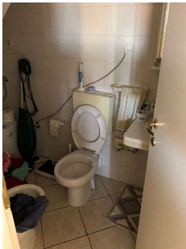
Foto 12 - lavanderia