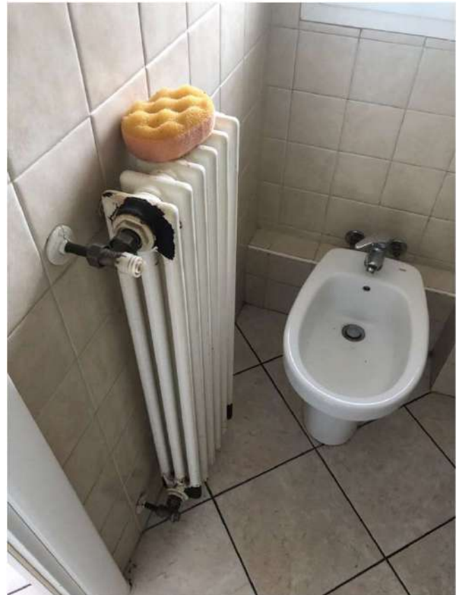
Foto 18 - lavanderia