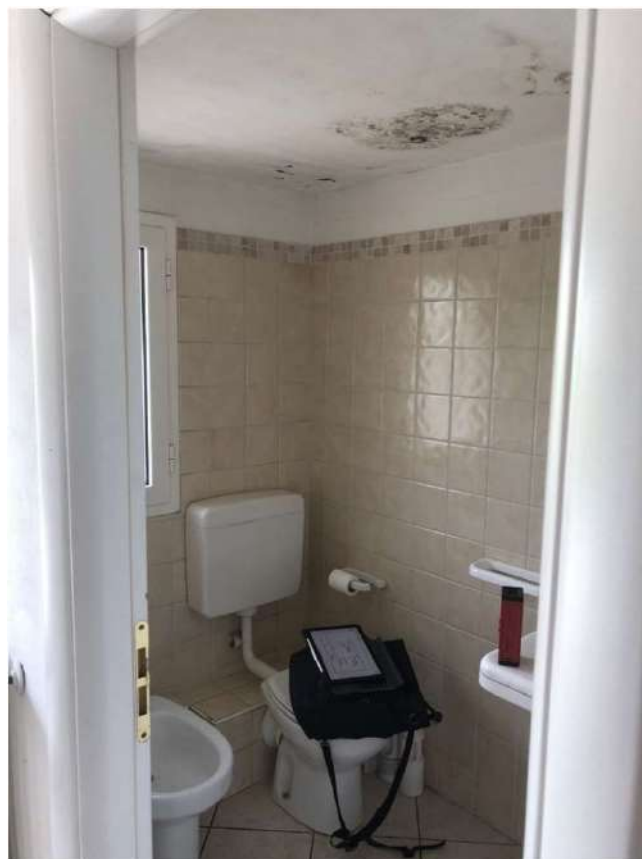
Foto 10 - lavanderia