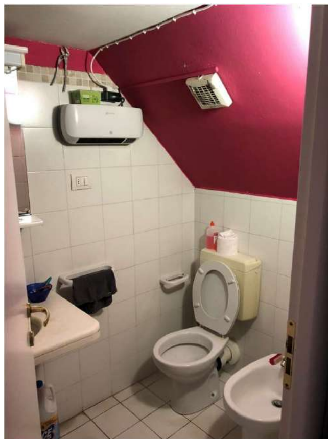
Foto 10 - lavanderia