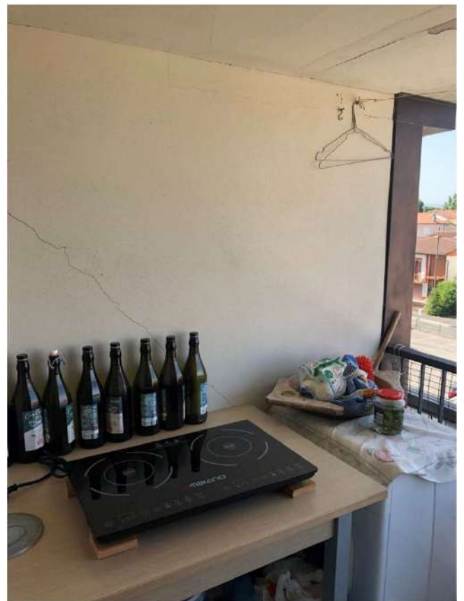
Foto 12 - terrazzo