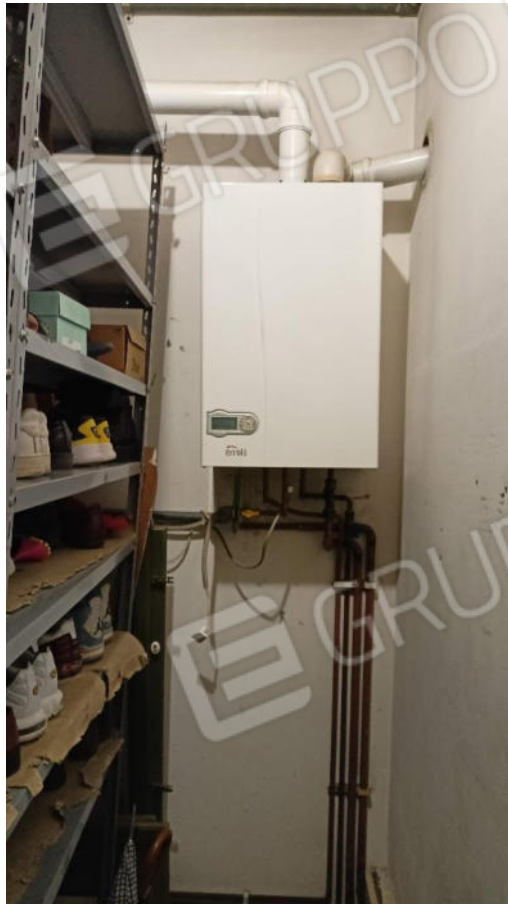
8. Locale Ripostiglio con caldaia