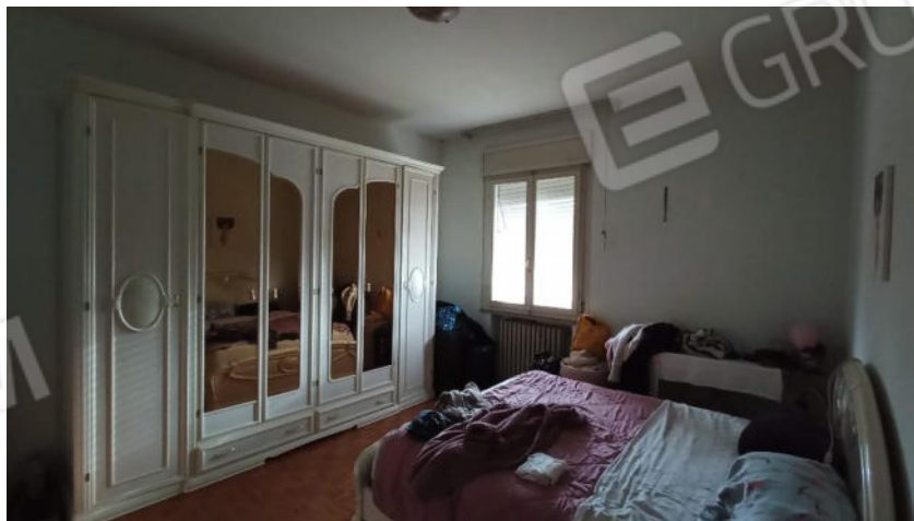
6. Camera da letto Lato SUD