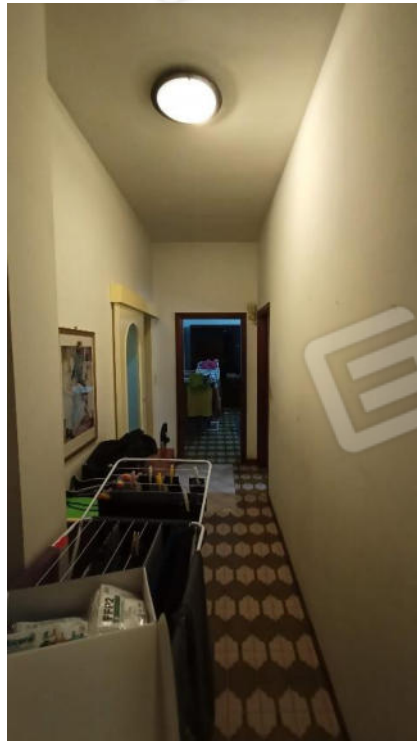
2- Corridoio Centrale abitazione