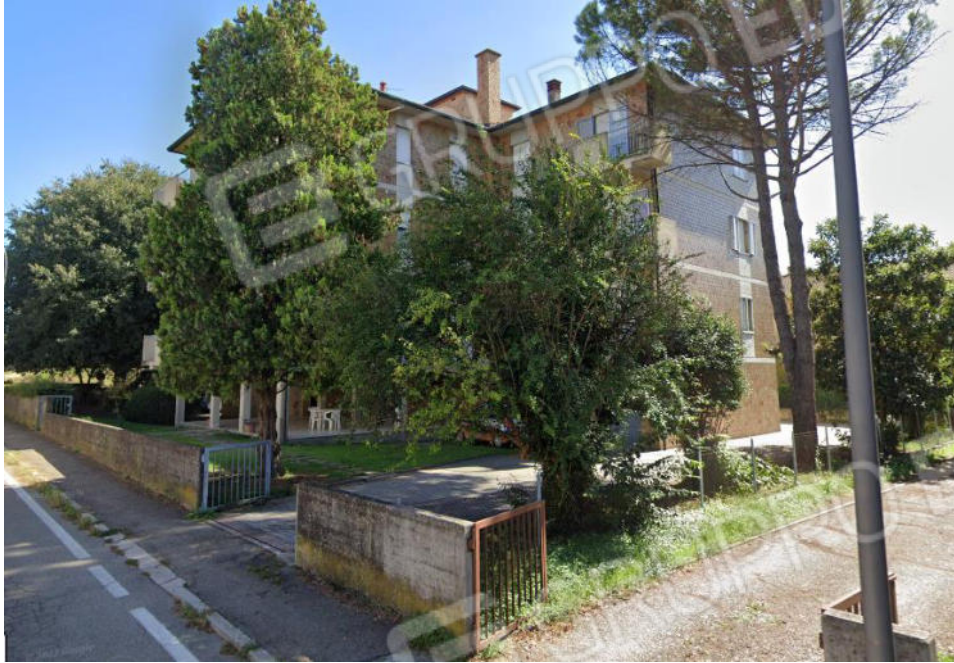
1 - Fronte principale edificio da Via Castelletto 3