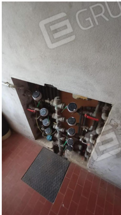
15. Contatori Acqua nel locale contatori