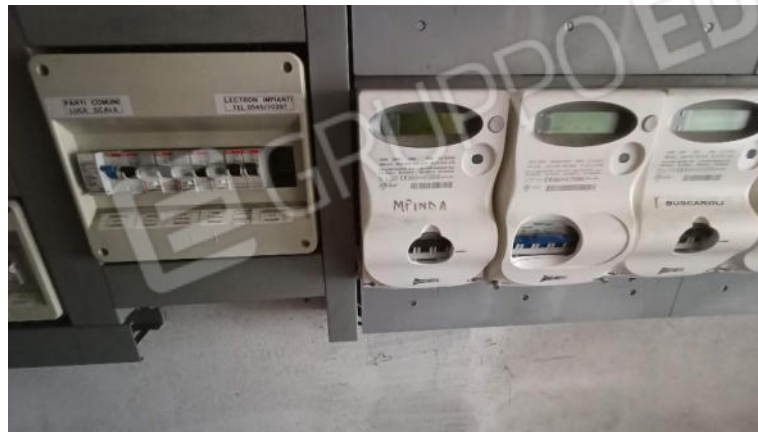
14. Quadro Contatori Energia Elettrica nel locale contatori