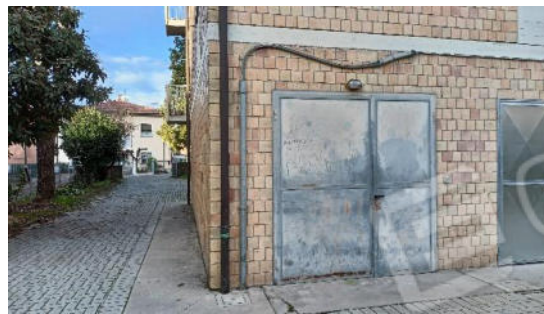
11. Porta zincata Garage