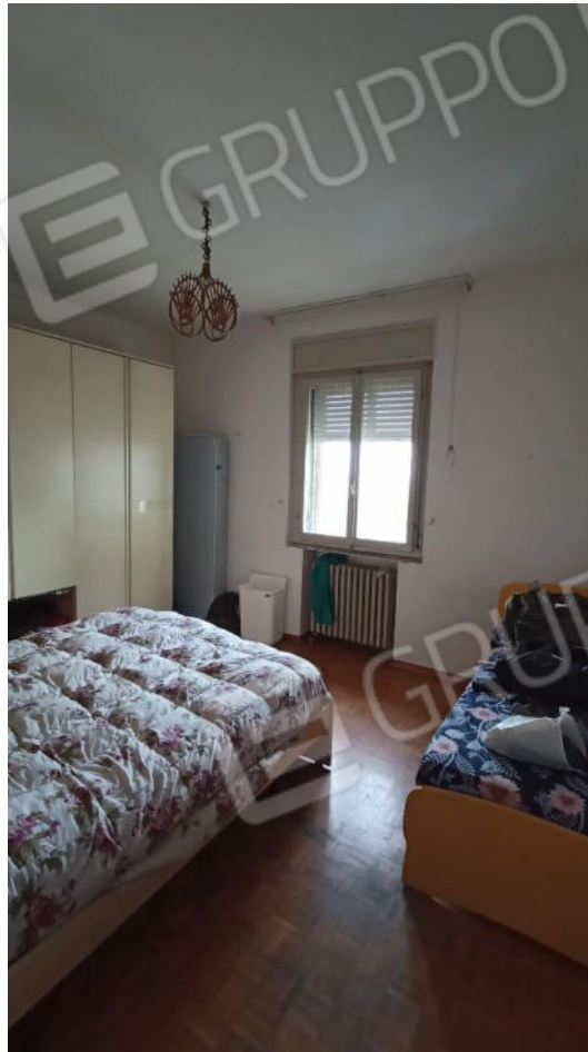
7.Seconda camera da letto Lato Ovest