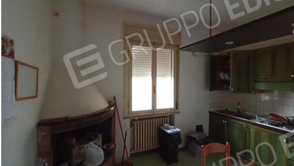
3- Cucina abitabile