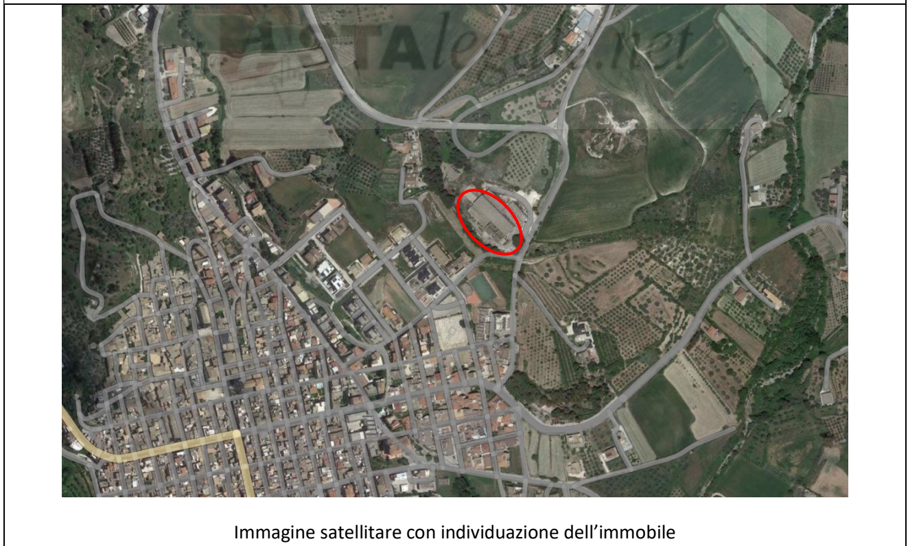
Immagine satellitare con individuazione dell'immobile