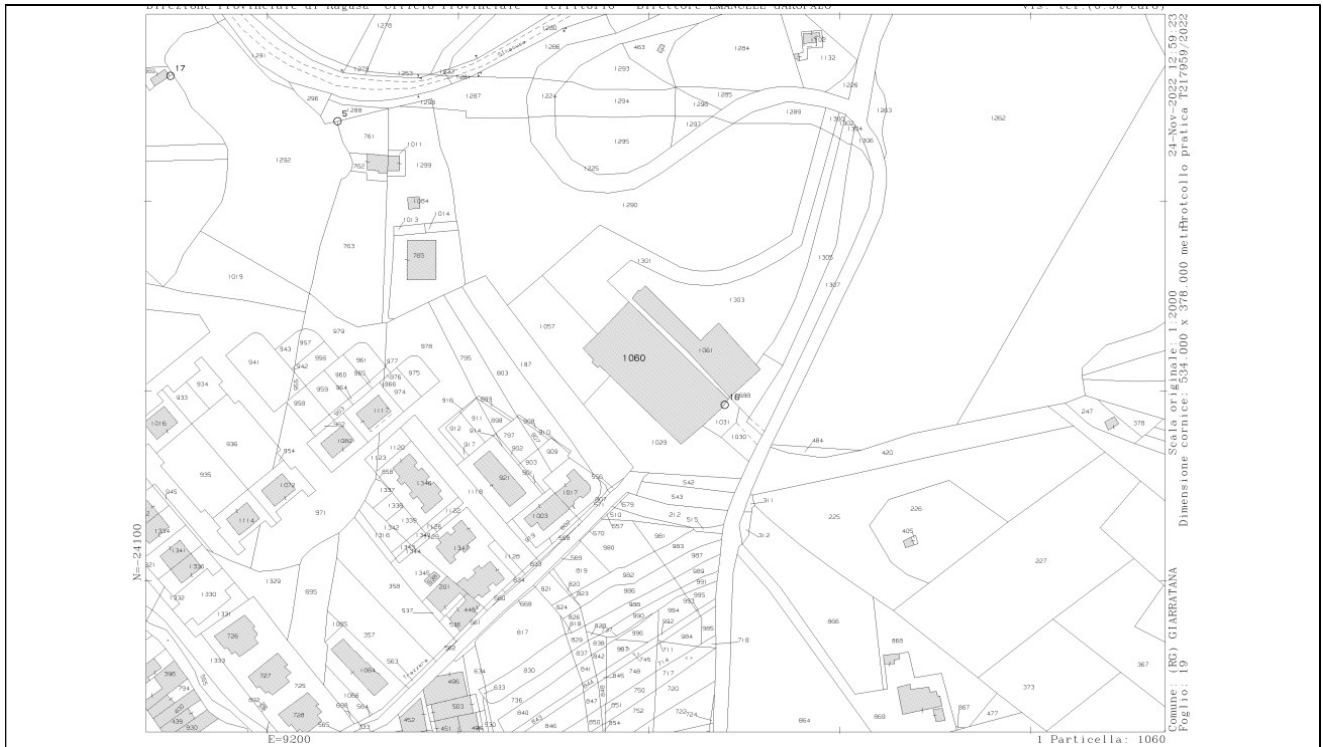
Estratto di mappa foglio 19