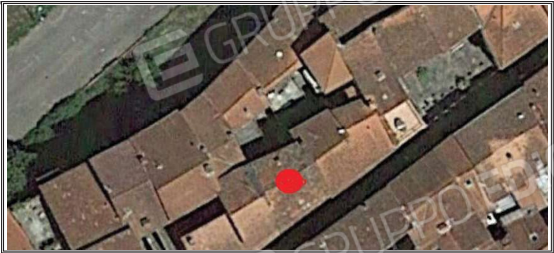
Foto n. 1 – Vista dall’alto con localizzazione unità oggetto di perizia