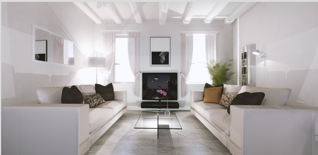
Ipotesi di soggiorno tipo | non vincolante ai fini contrattuali - commerciali