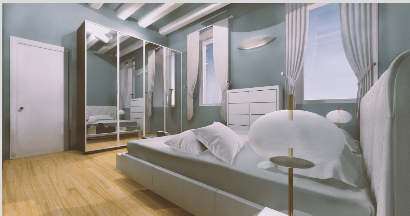
Ipotesi di camera da letto tipo | non vincolante ai fini contrattuali - commerciali