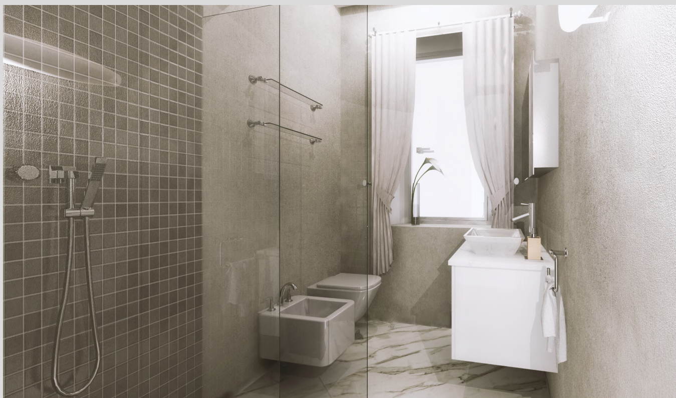
Ipotesi di bagno tipo | non vincolante ai fini contrattuali - commerciali