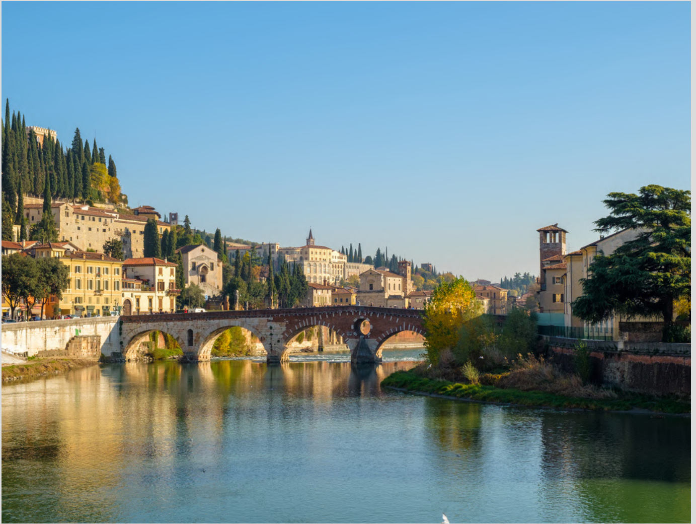
Veduta su Ponte Pietra con il quartiere di Veronetta alle sue "spalle"