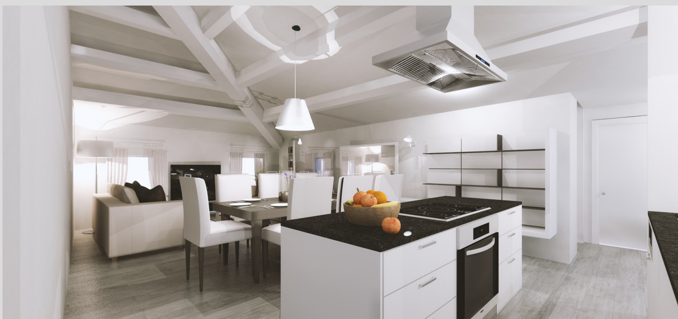
Ipotesi di cucina tipo | non vincolante ai fini contrattuali - commerciali