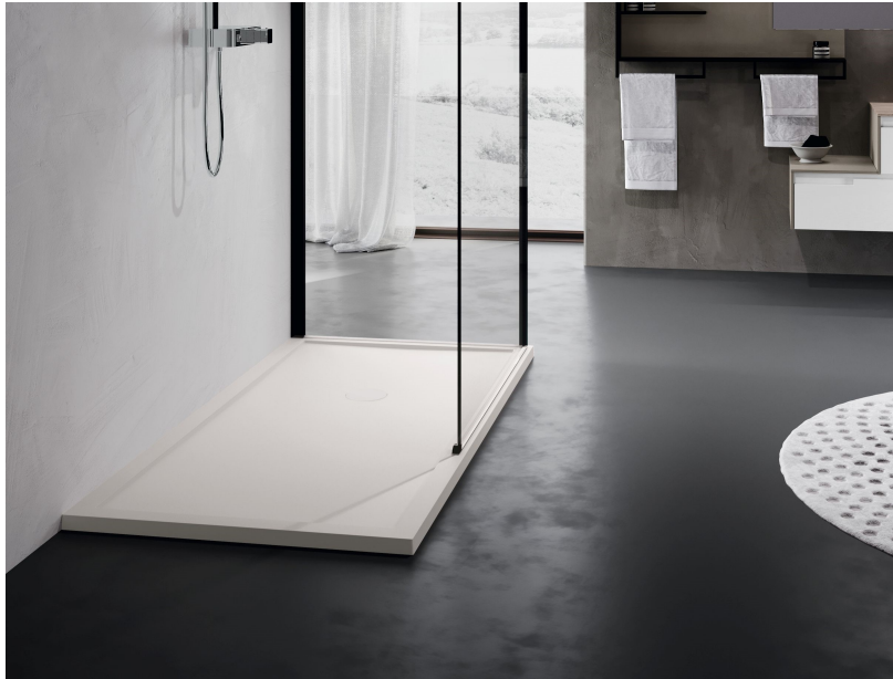
Piatto doccia Novellini Olympic o Ercos modello Stone mis. 80x120 cm con miscelatore e saliscendi Grohe serie Focus