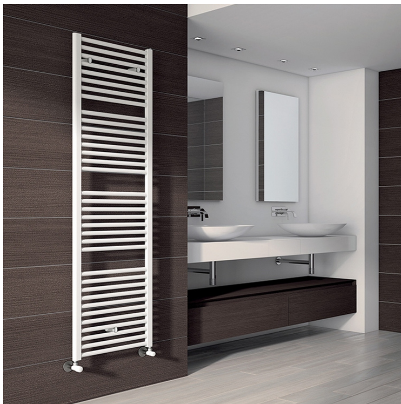
Termoarredo Irsap serie Ares colore bianco