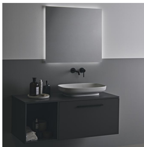
Lavabo d'appoggio Ideal Standard modello ILIFE con miscelatore monocomando Grohe serie Focus