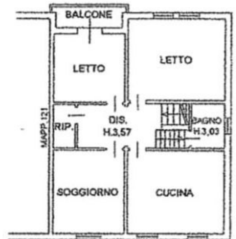
PIANO PRIMO SCALA 1:200