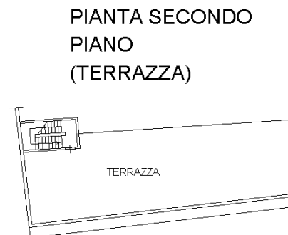
PIANTA SECONDO PIANO (TERRAZZA)