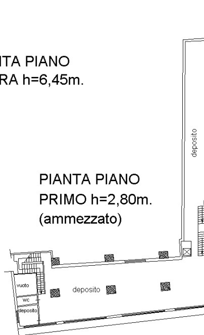
PIANTA PIANO PRIMO h=2,80m. (ammezzato)