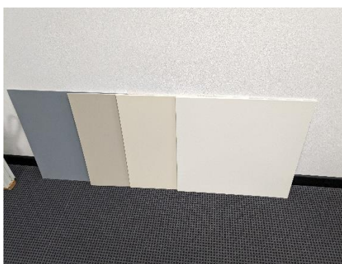
COLORAZIONE PORTE INTERNE