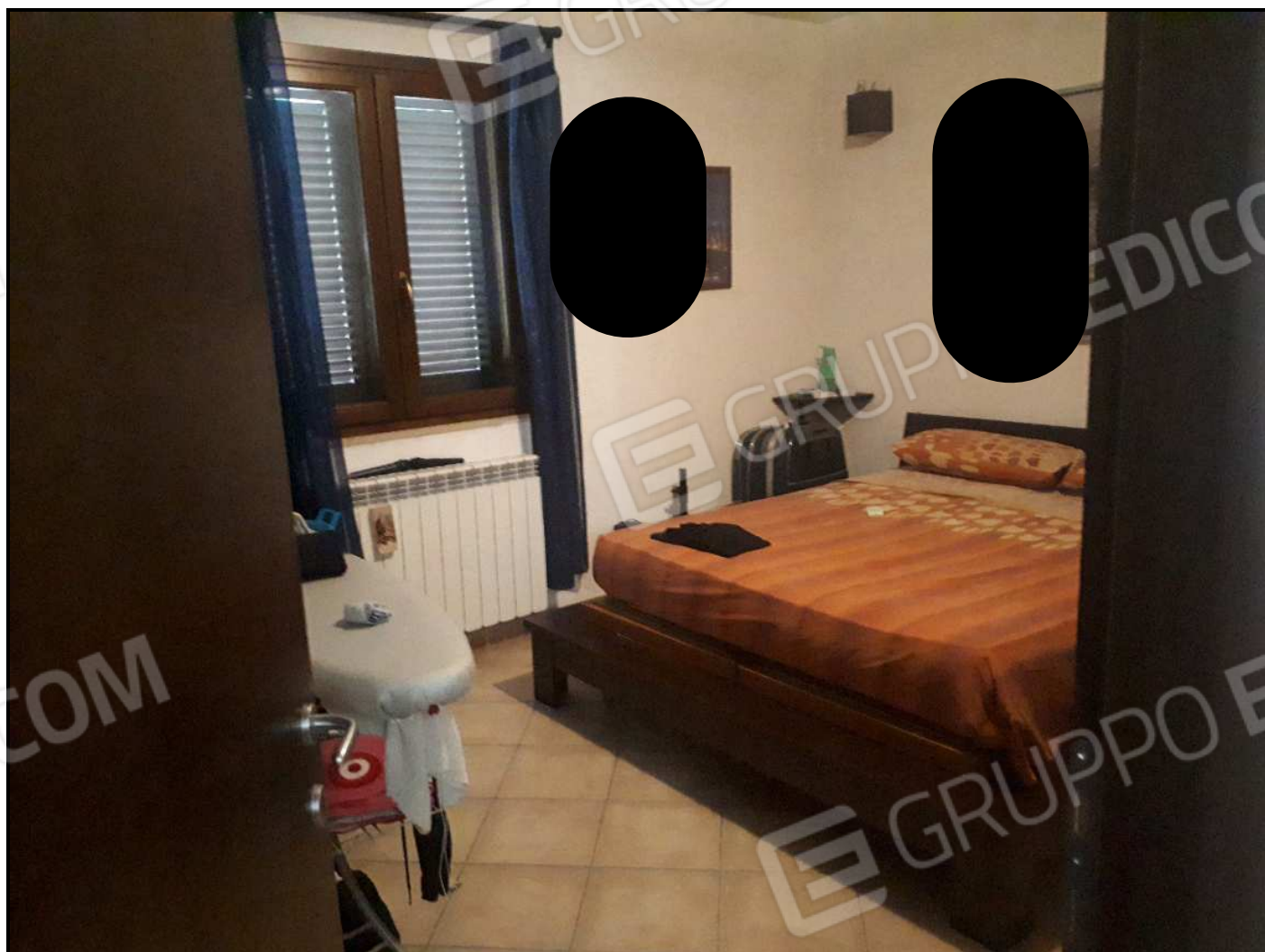
Camera da letto al piano terra