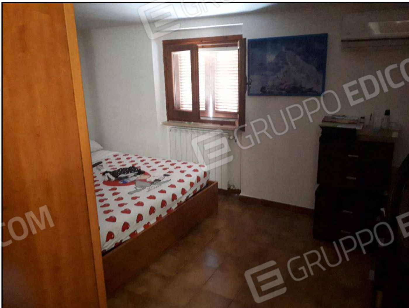
Altra camera da letto al piano 1°