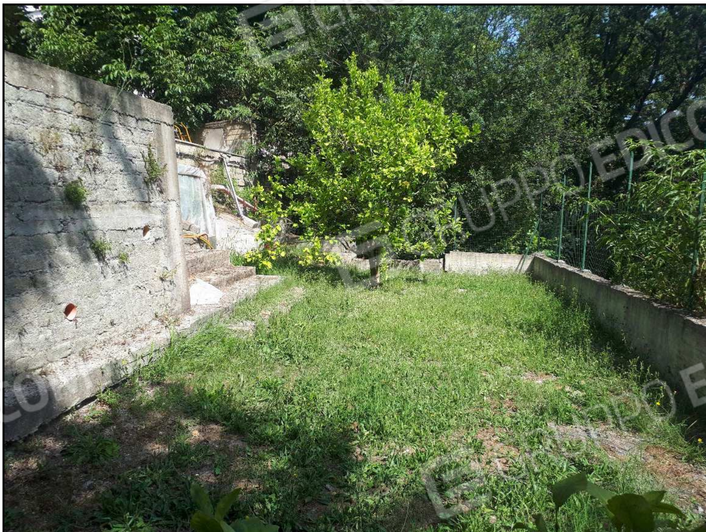
Parte dell'area esterna