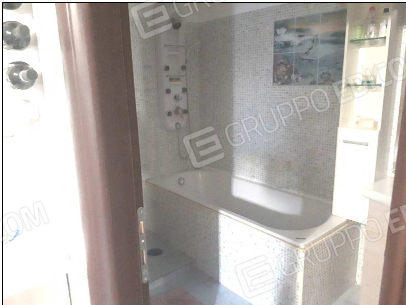
Locale igienico al piano seminterrato