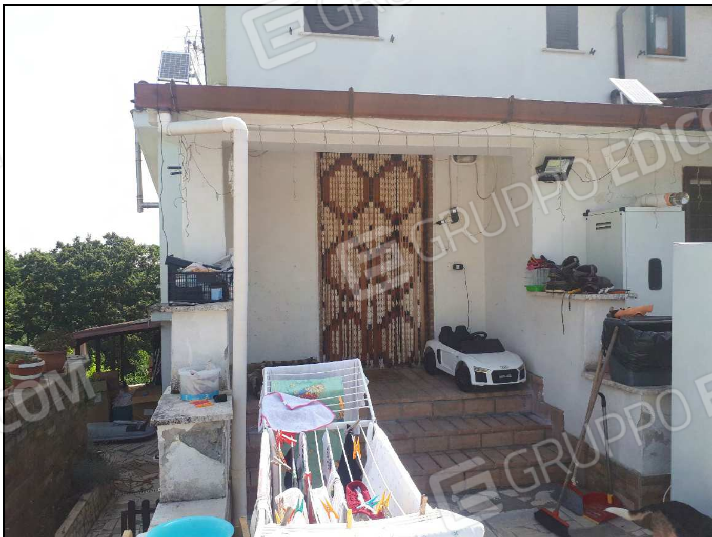
Accesso principale al piano terra