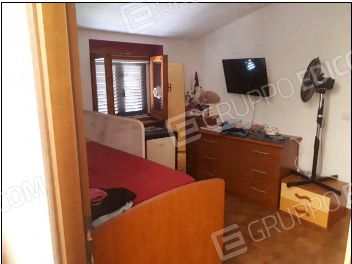
Camera da letto al piano 1°