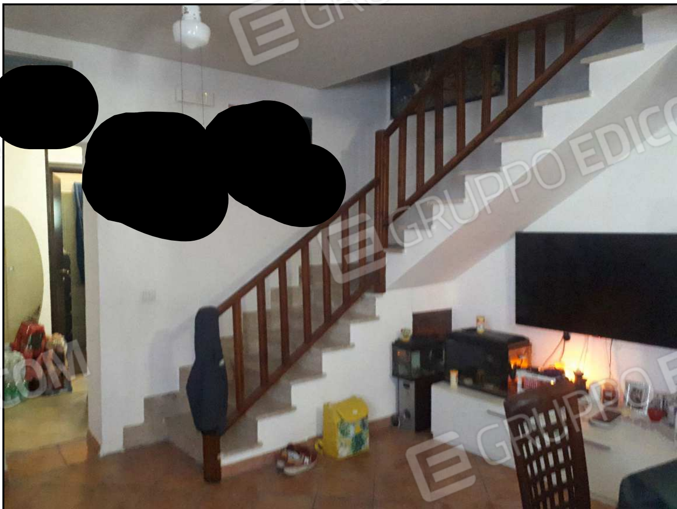
Scala di accesso al piano 1°