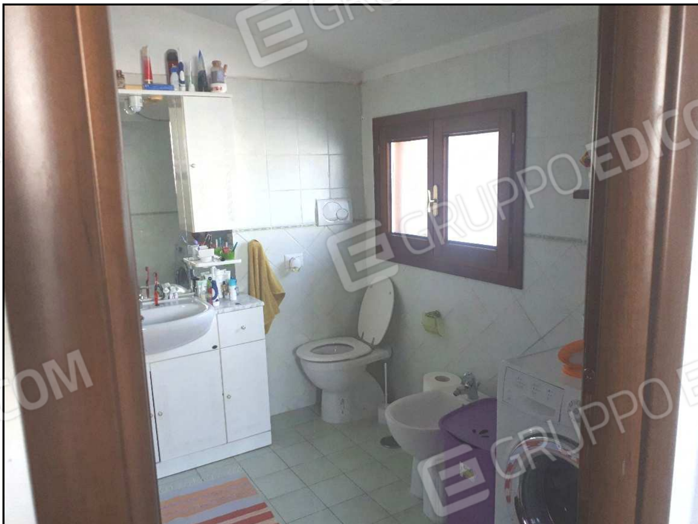
Altro locale igienico al piano terra