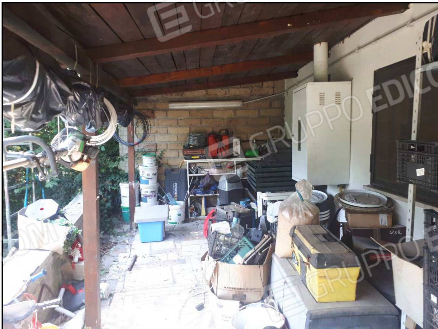
Portico al piano seminterrato