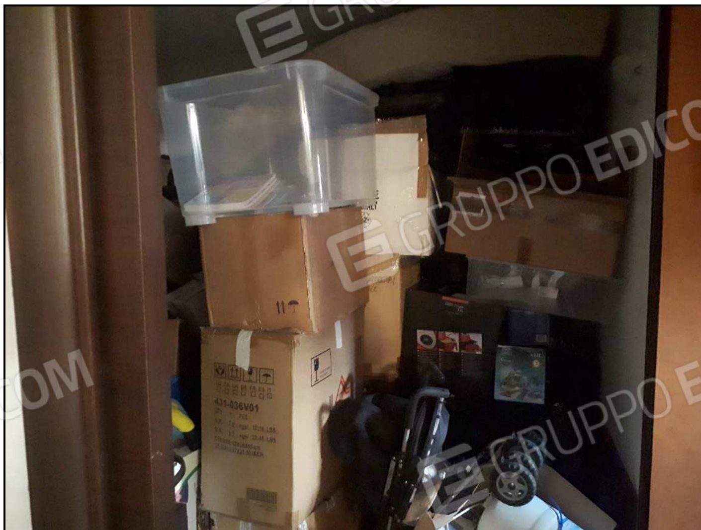
Locale deposito al piano seminterrato