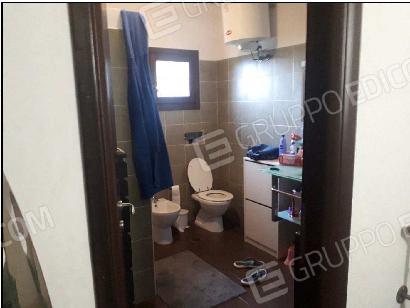
Locale igienico al piano terra