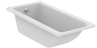
VASCA IDEAL STANDARD Connect air