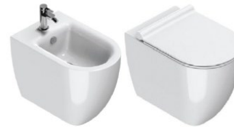
VASO e BIDET CATALANO a pavimento