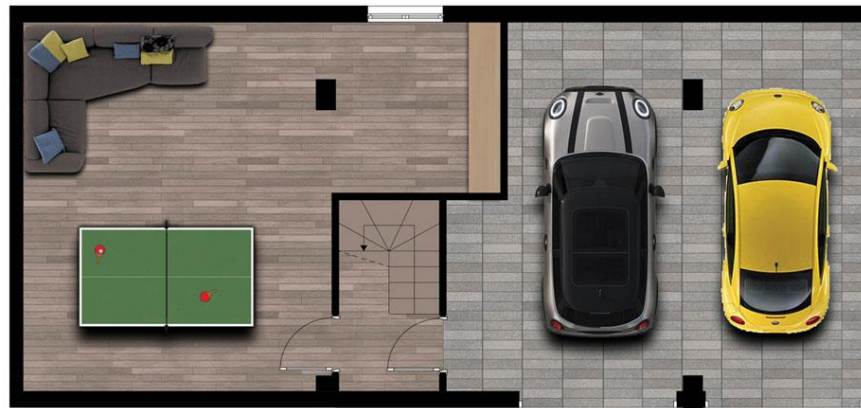
↑ ↑ PIANO INTERRATO