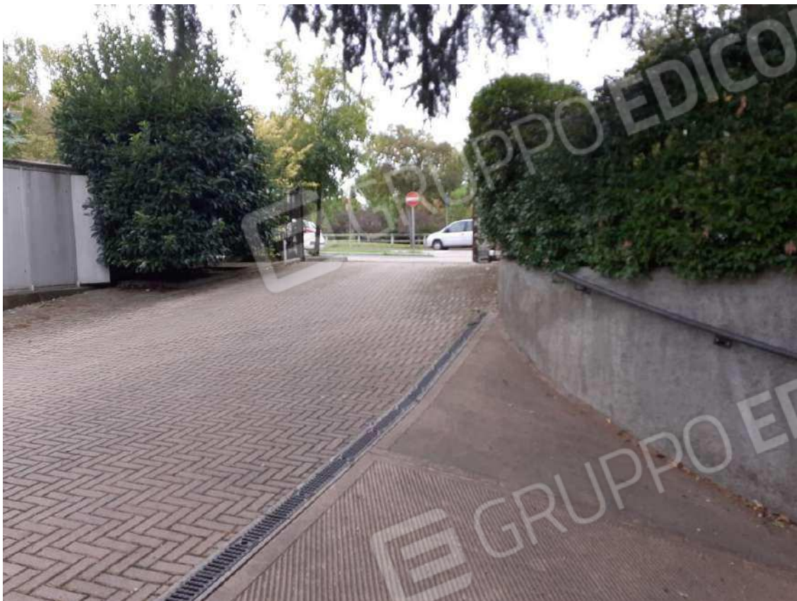
RAMPA DI INGRESSO ALLA RIMESSA INTERRATA