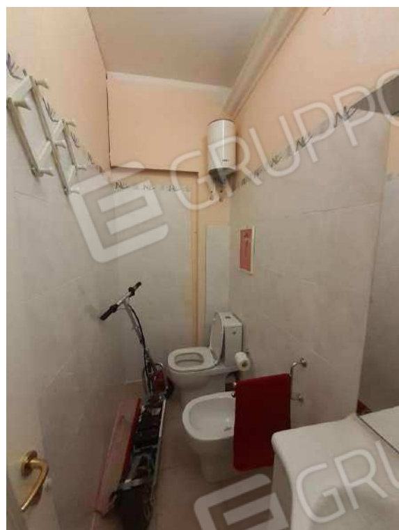
INTERNI SUB 80 - 1° BAGNO REALIZZATO IN ASSENZA DI TITOLO AUTIZZATIVO E NON RAPPRESENTATO NELLA PLANIMETRIA CATASTALE