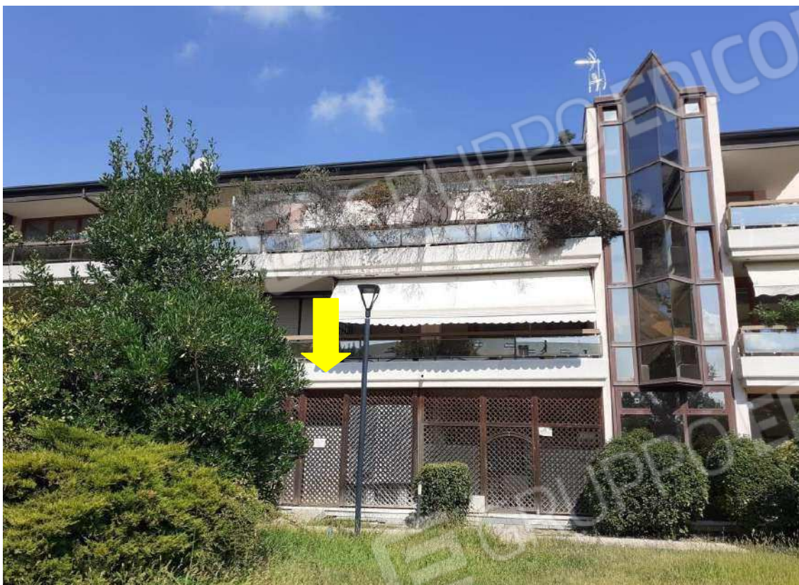
PROSPETTO SUD DEL FABBRICATO – INGRESSO U.I.80 POSTO SUL RETRO