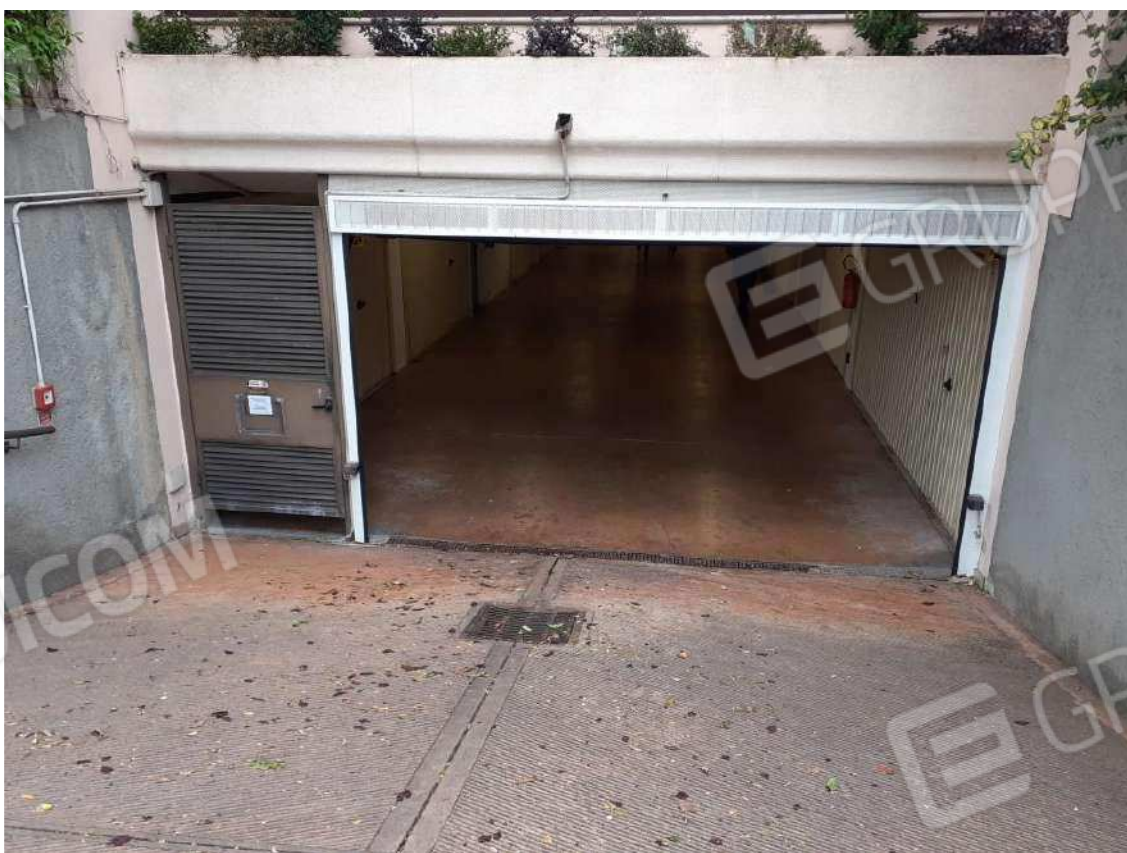
INGRESSO DELLA RIMESSA INTERRATA AL PIANO SOTTOSTRADA