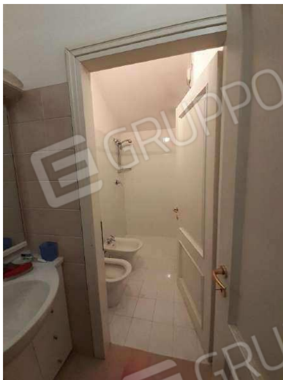
INTERNI SUB 80 - 2° BAGNO