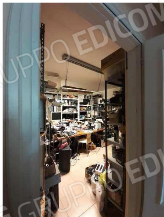
INTERNI SUB 80