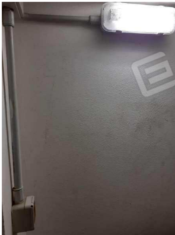
PARTICOLARE IMPIANTO ELETTRICO DELLA CANTINETTA SUB 141