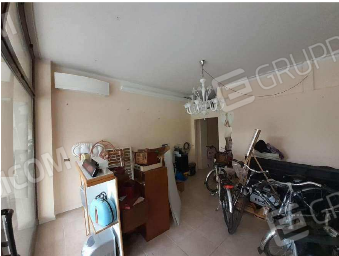
INTERNI SUB 80