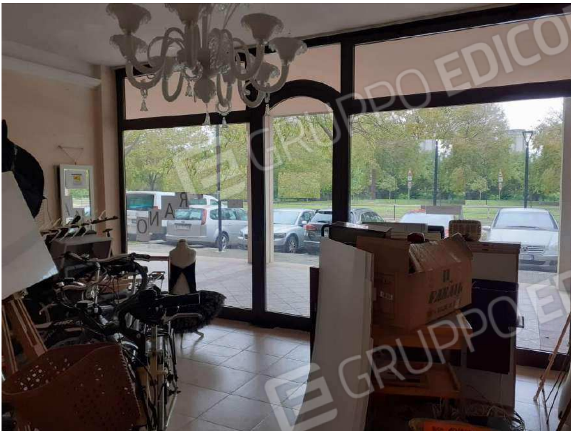
INTERNI SUB 80