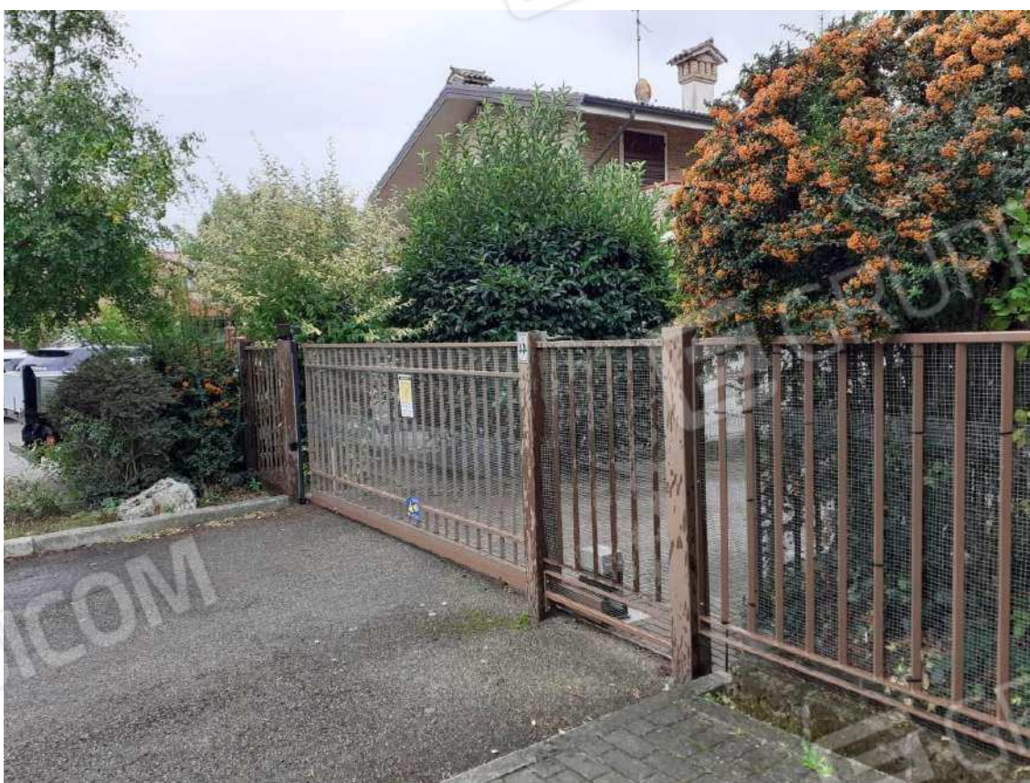
CANCELLO CARRABILE MOTORIZZATO PER L'ACCESSO ALLA RAMPA DI INGRESSO ALLA RIMESSA INTERRATA