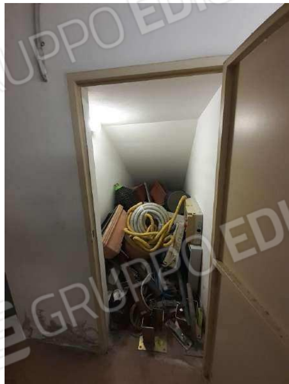
SUB 141 - CANTINETTA - RIMESSA INTERRATA