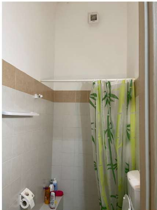
Figura 6: Lotto 2 - Piano Terra servizi igienici ai quali si accede dalla prima camera da letto di cui alla foto precedente