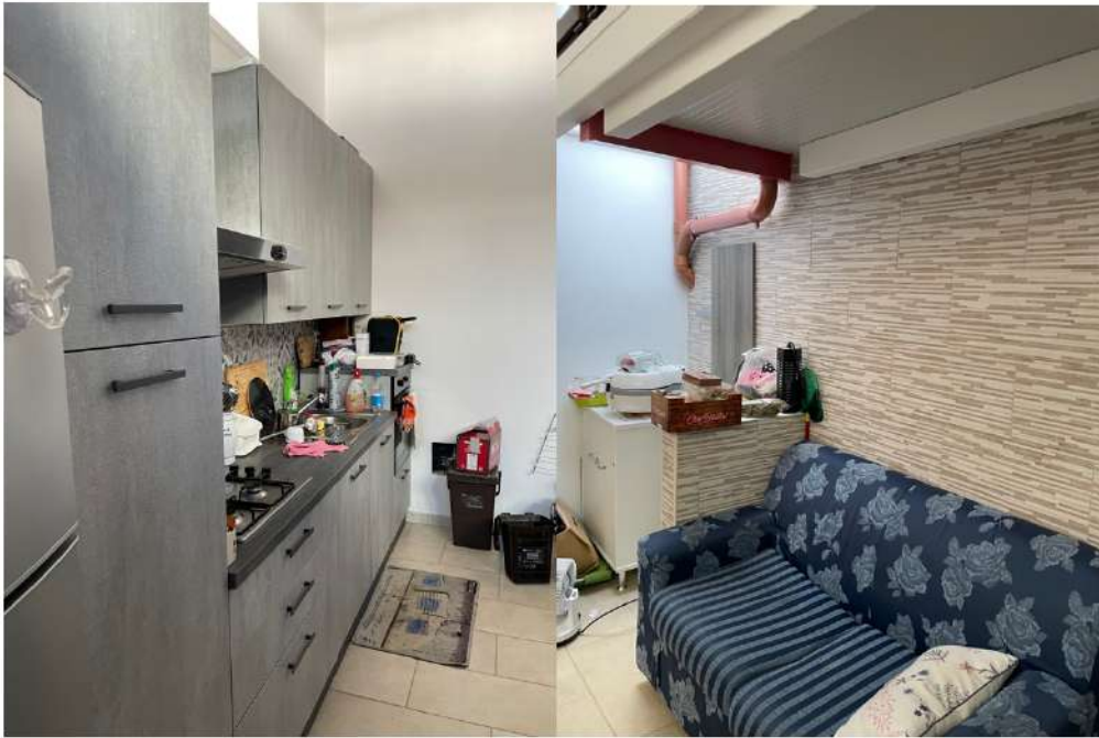
Figura 13: - Lotto 2 - Piano Terra Cucina, zona pranzo