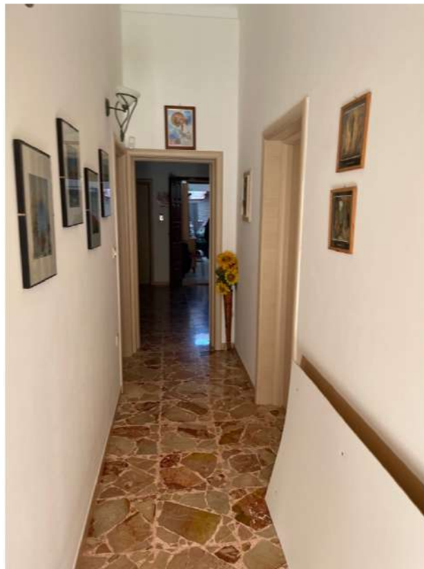
Figura 4: Lotto2 - Piano Terra ingresso e corridoio