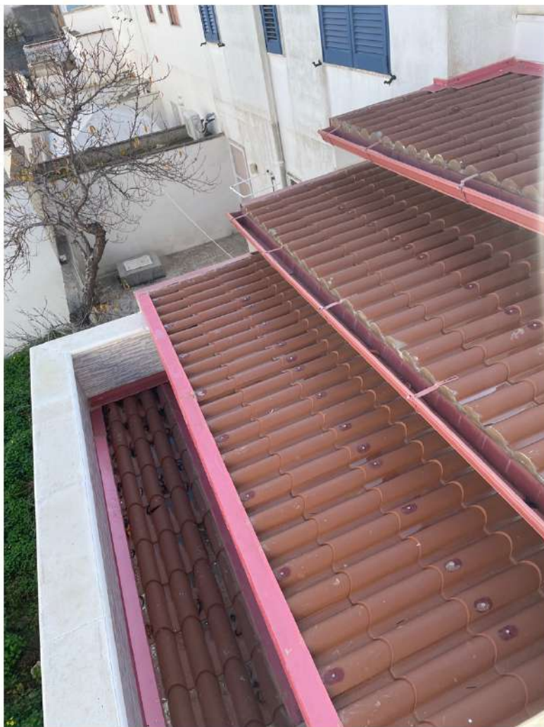
Figura 16: Lotto 2 - Lastrico solare zona posteriore con particolare della copertura zona cucina/pranzo