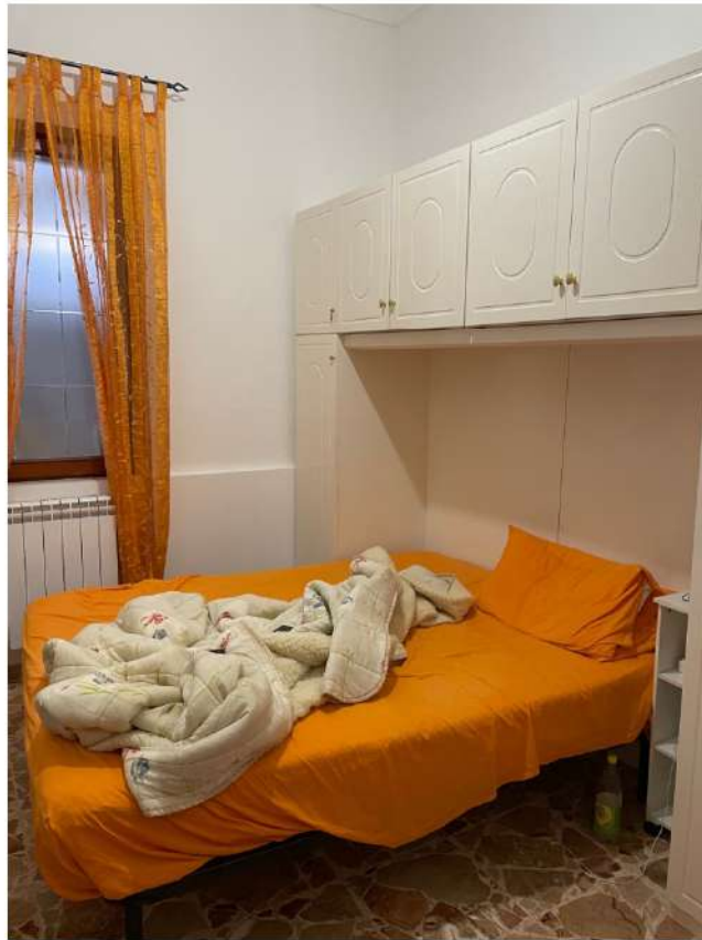
Figura 9: Lotto 2 - Piano Terra terza camera da Letto su lato destro guardando il fronte