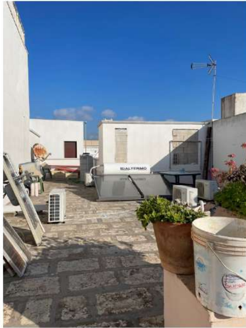
Figura 15: Lotto 2 - Lastrico solare visto dall'accesso dato con rampa di scale sul fronte edificio