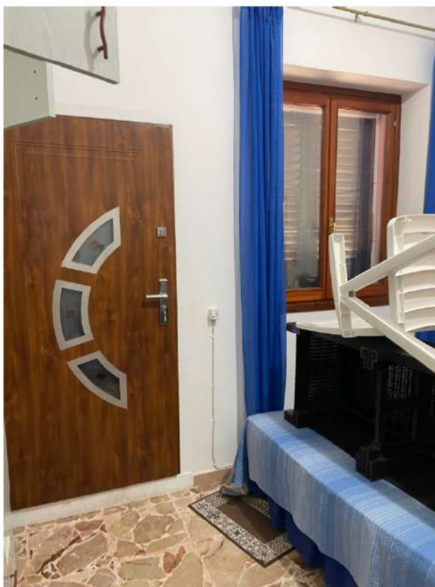
Figura 7: Lotto 2 - Piano Terra seconda camera da Letto su lato sinistro guardando il fronte