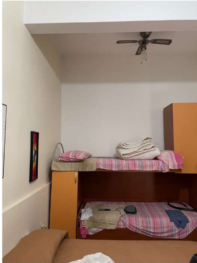
Figura 11: Lotto 2 - Piano Terra quarta camera da Letto su lato sinistro guardando il fronte