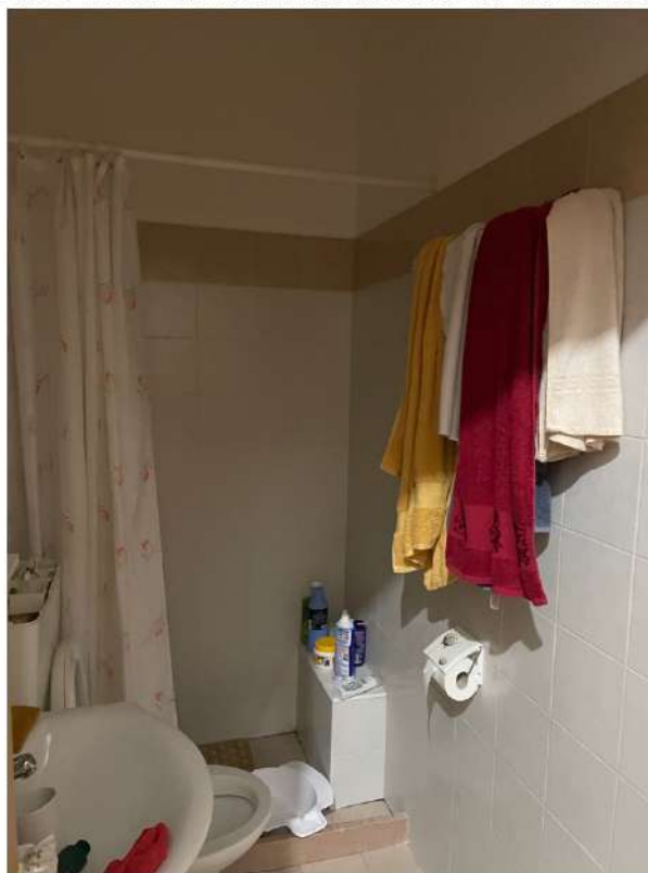
Figura 10: Lotto 2 - Piano Terra servizi igienici ai quali si accede dalla terza camera da letto di cui alla foto precedente