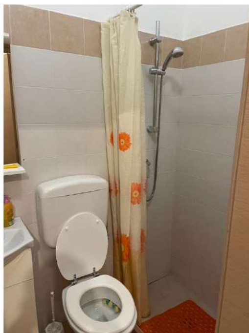
Figura 8: Lotto 2 - Piano Terra servizi igienici ai quali si accede dalla seconda camera da letto di cui alla foto precedente