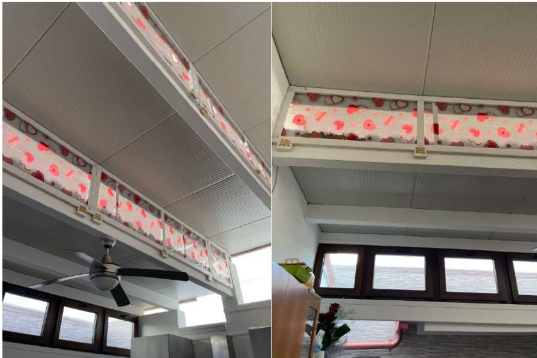
Figura 14: - Lotto 2 Piano Terra particolari della copertura della zona adibita a cucina, zona pranzo