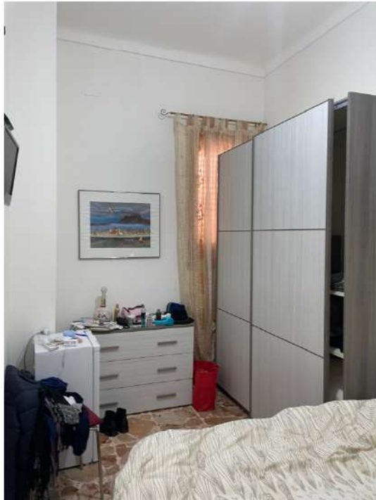
Figura 5: Lotto 2 - Piano Terra Prima camera da Letto su lato sinistro guardando il fronte immobile