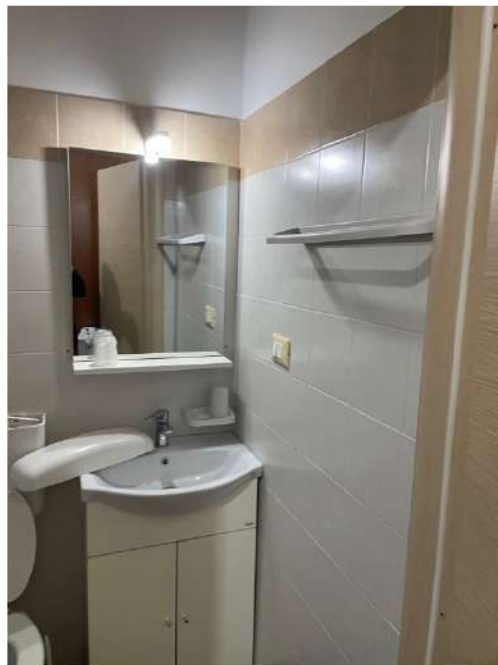
Figura 12: Lotto 2 - Piano Terra servizi igienici ai quali si accede dalla quarta camera da letto di cui alla foto precedente