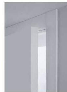
Porto Lualdi - LCD62 - Capitolato Base