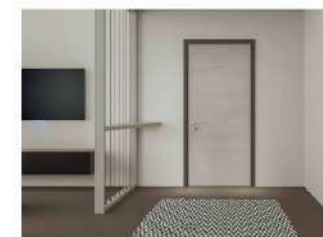
Scigno porte antieffrazione