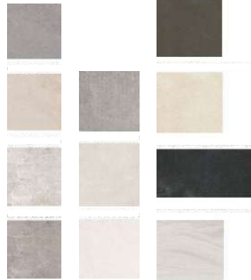
Gres EFFETTO PIETRA/CEMENTO