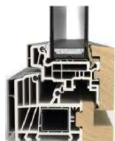
Serramenti FIN-Ligna Slim-line 84/105-8 Alluminio-Legno