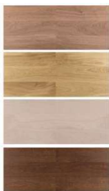
Parquet serie Tortona