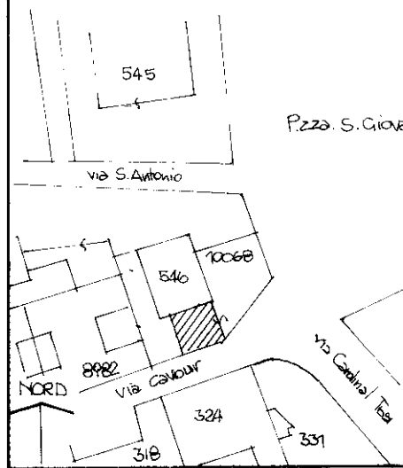
ESTRATTO DI MAPPA sc 1:1000 Comune di BUSTO A. Foglio 29 - mappale 10068