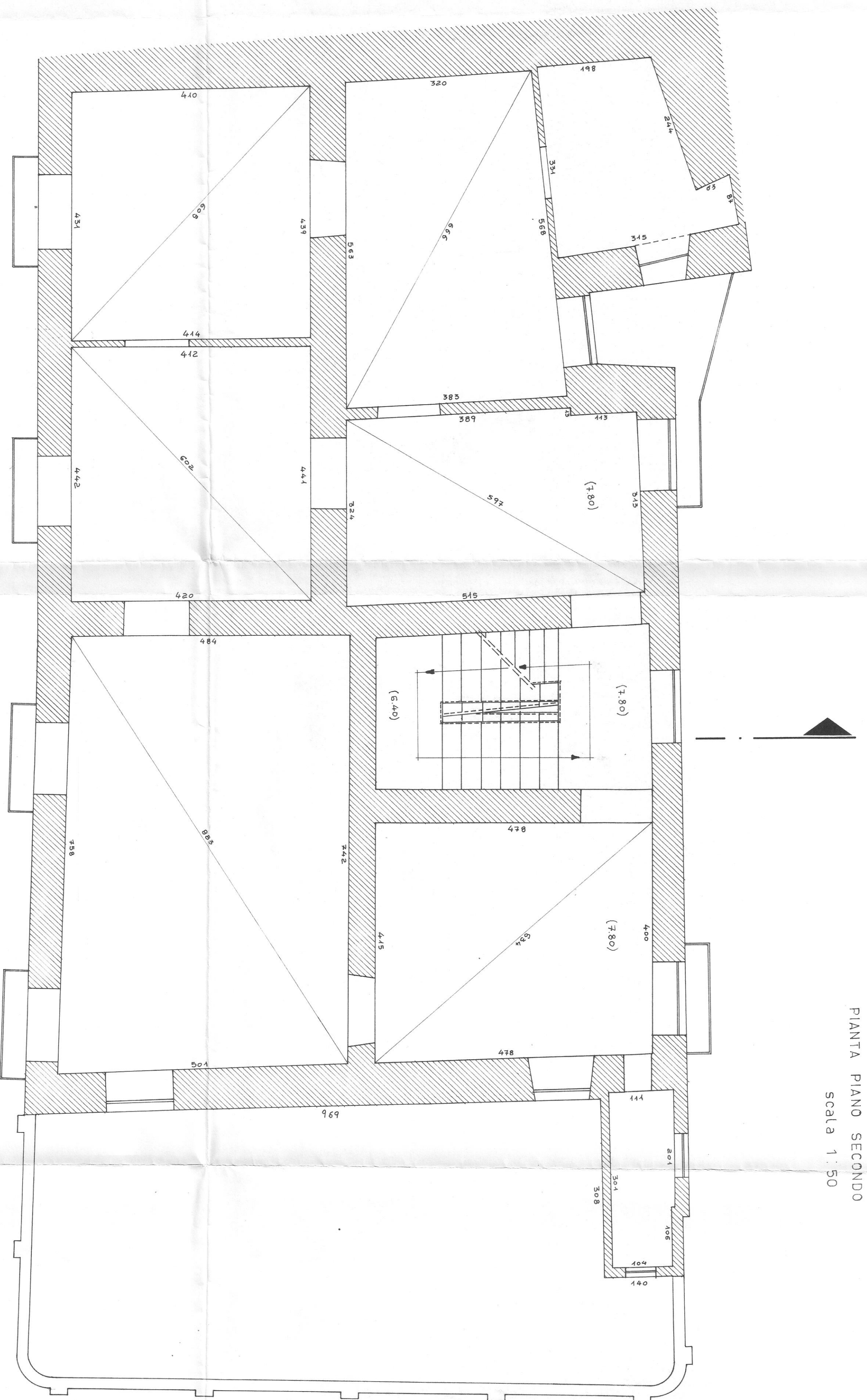
PIANTA PIANO SECONDO scala 1 : 50