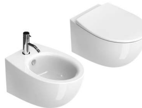
Sanitari Italy New Flush by Catalano