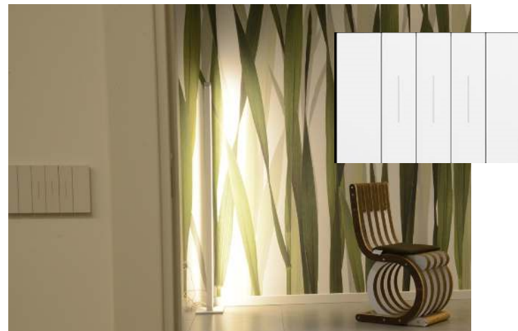
Frutti Bticino serie Living NOW colore bianco

Videocitofono connesso: grazie al videocitofono connesso alla rete dell'abitazione e all'APP Bticino Door Entry collegata al cloud di Bticino, le chiamate videocitfoniche arriveranno sullo schermo dello Smartphone, si potrà quindi rispondere e aprire la serratura del cancello di ingresso condominiale ovunque ci si trovi. Il videocitofono sarà anche collegato alla postazione della portineria per una agevole comunicazione con il portiere.