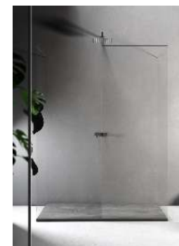
Piatto Doccia mod. Mood by Relax Design