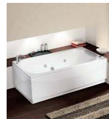
Vasca tipo Calos, by Novellini