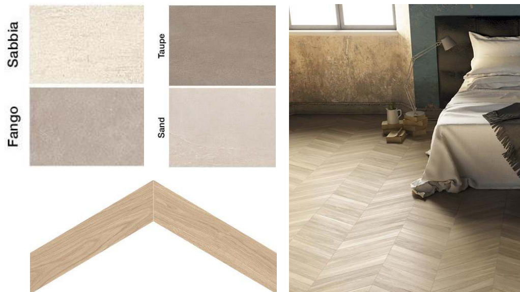
Serie Mimesis Ecrú Chevron di EmilGroup

Zone tecniche e piano box cantine in cemento elicotterato.