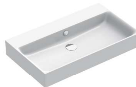
Lavabo New Premium by Catalano