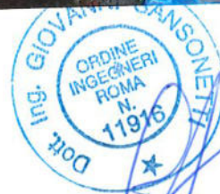
ALL. "FOTO 8"