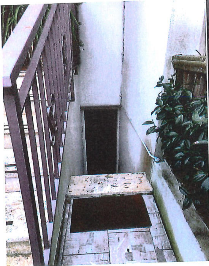
ingresso posto auto