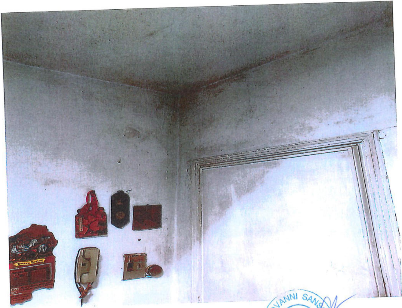
umidità ed infiltrazioni