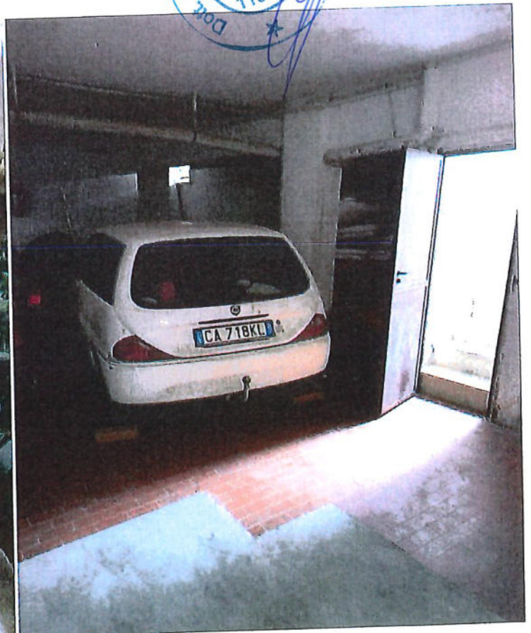
posto auto coperto