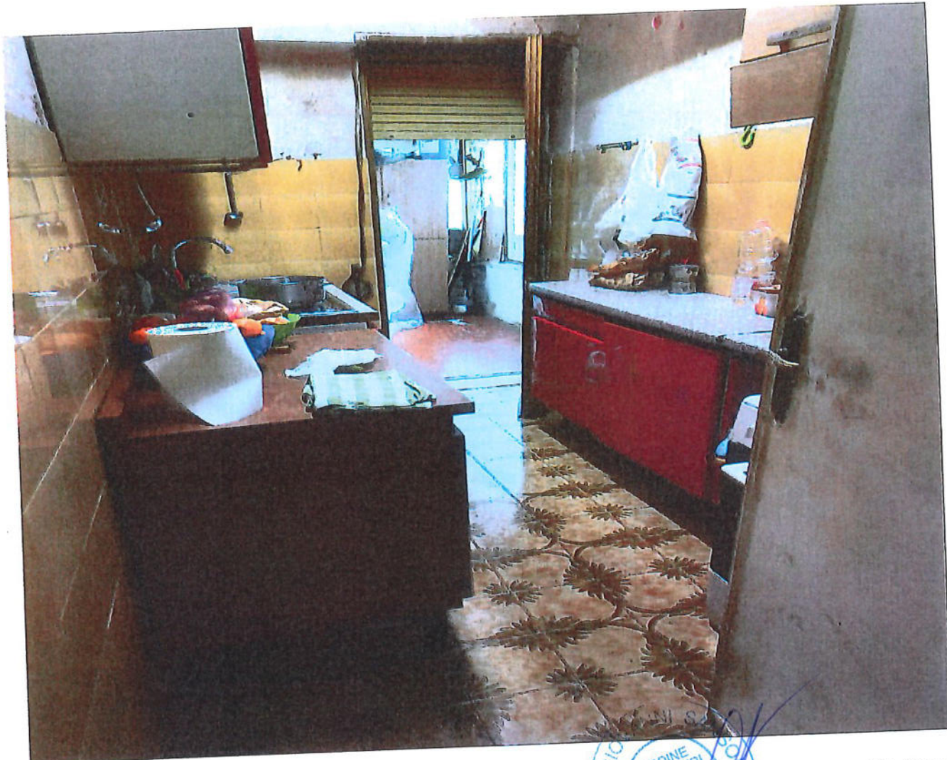
cucina e servizio igienico