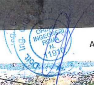
ALL. "FOTO 2"