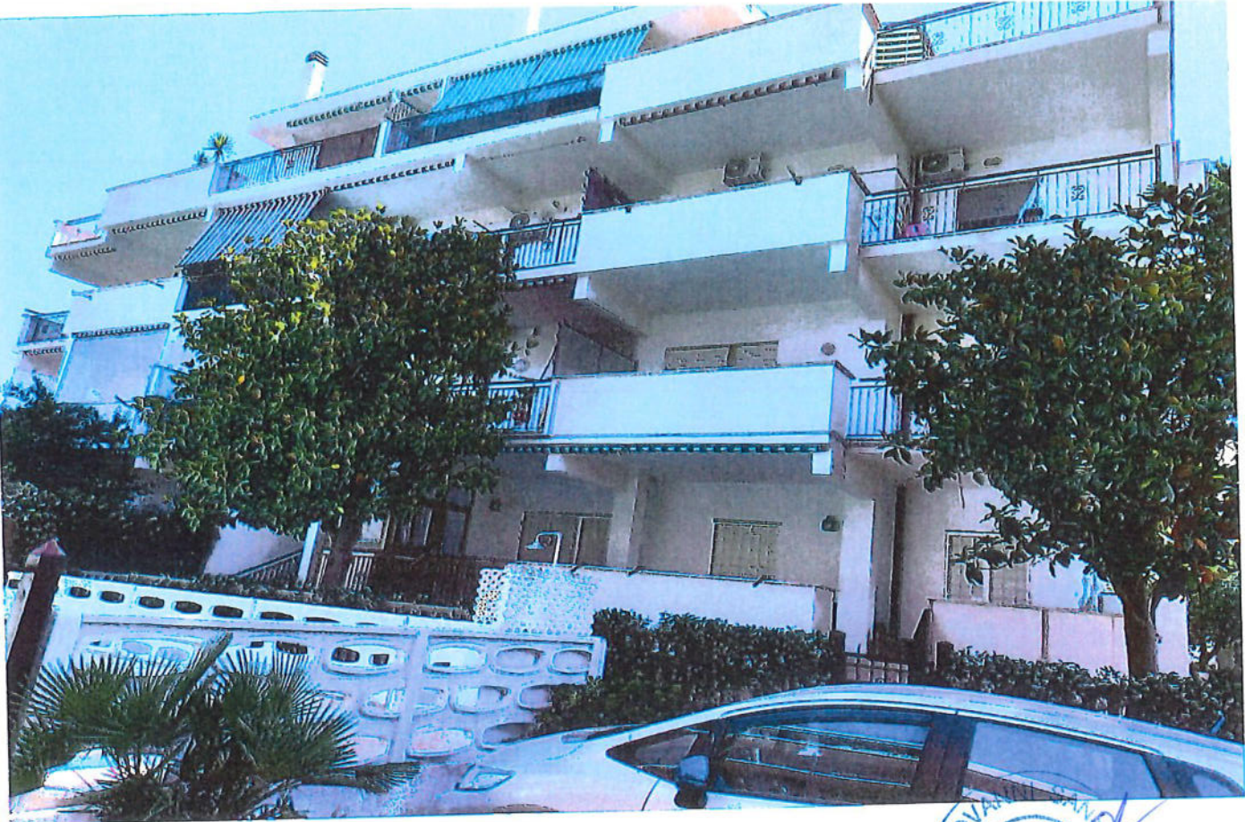
prospetto immobile ed ingresso