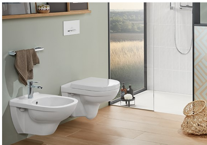
WC e bidet sospesi Villeroy & Boch serie O-Novo con relativa rubinetteria Hansgrohe serie Focus E2 o similari