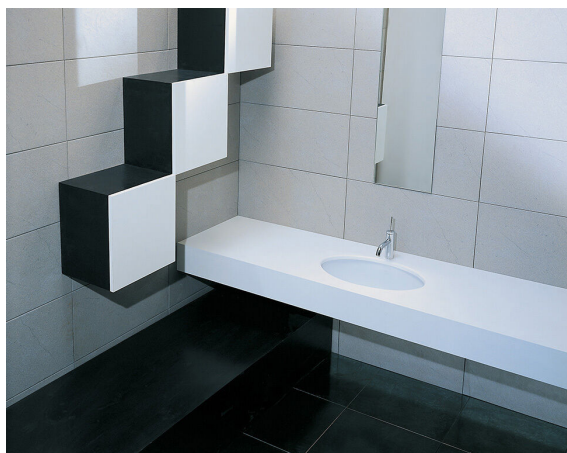
Scelta tra lavabo d'appoggio Vitra o sottopiano Diana con relativa rubinetteria Hansgrohe serie Focus E2 o similari