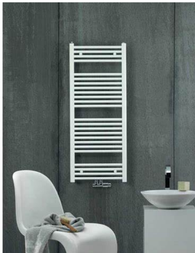
Termoarredo Zehnder serie Aura colore bianco - dim. 1200x600 cm