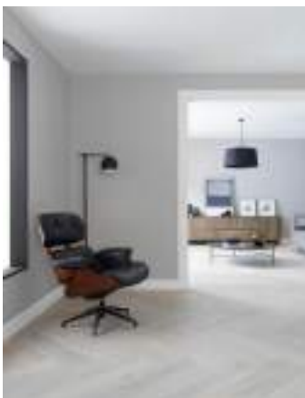
SMART TANZANIA white, almond, natural, nut, silver