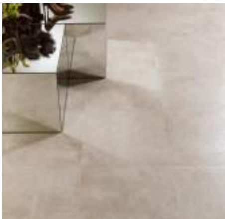
BALTIMORE beige, grey, white, natural

Pavimenti marca Porcelanosa (a titolo di esempio)