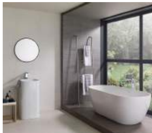
JAPAN blanco, marine