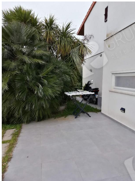
AREA ESTERNA PAVIMENTATA