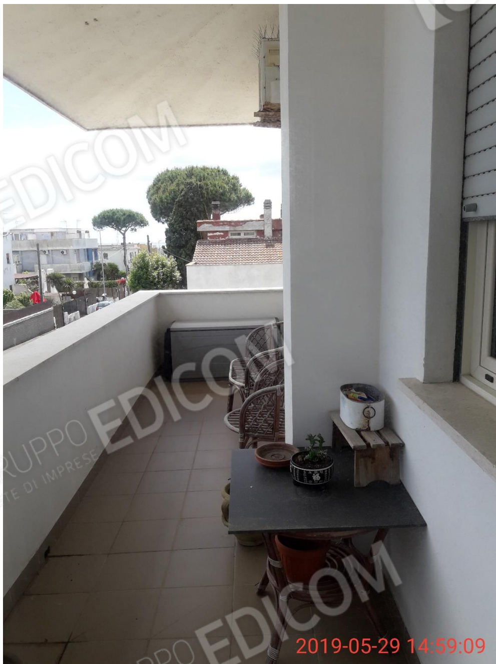
Figura 23 piano primo, balcone 5