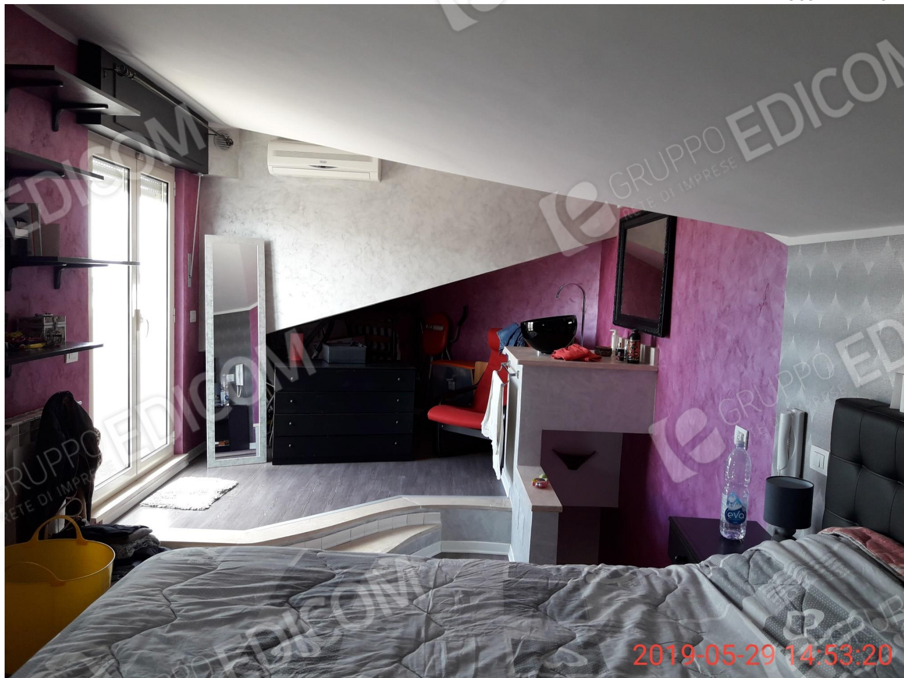
Figura 27 piano secondo, soffitta non abitabile adibita a camera da letto