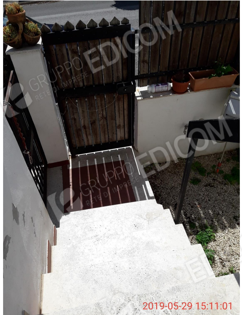
Figura 3 cancello pedonale di ingresso alla proprietà