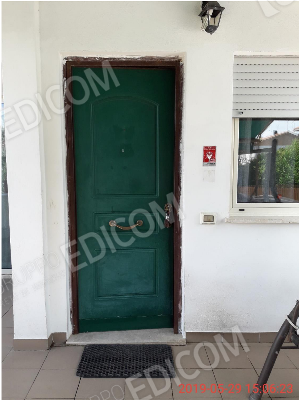
Figura 4 portone di ingresso al villino