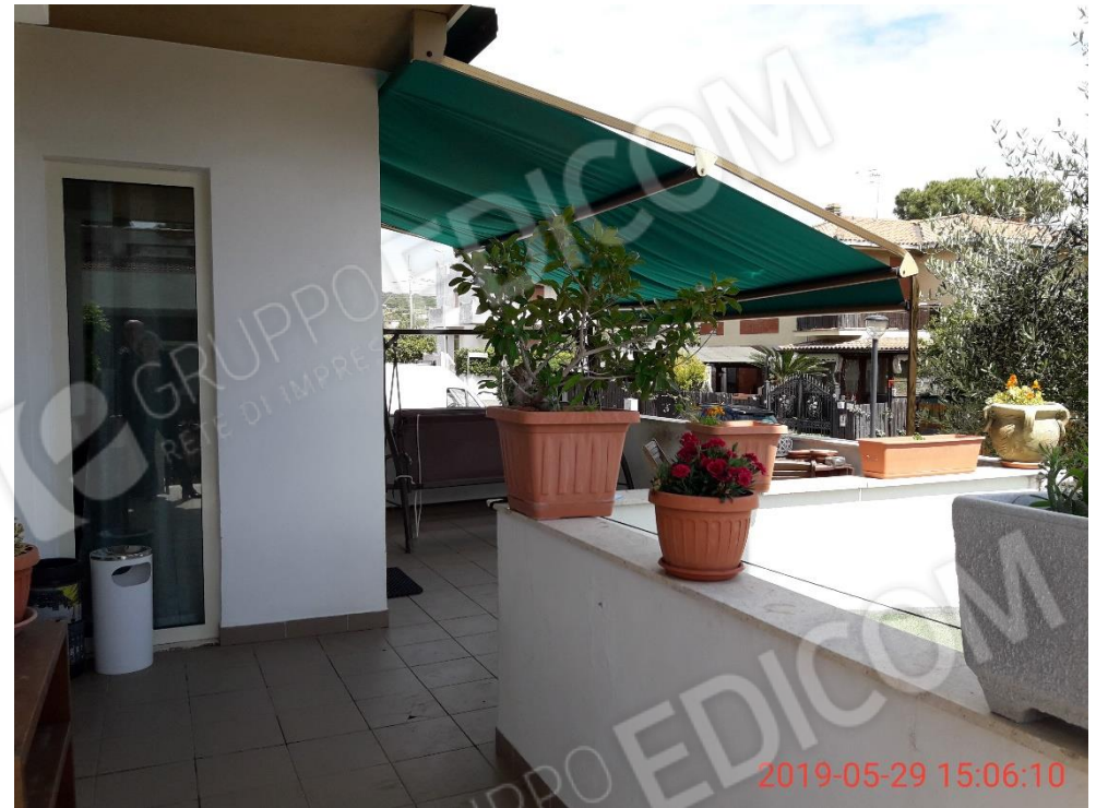
Figura 5 balcone 1