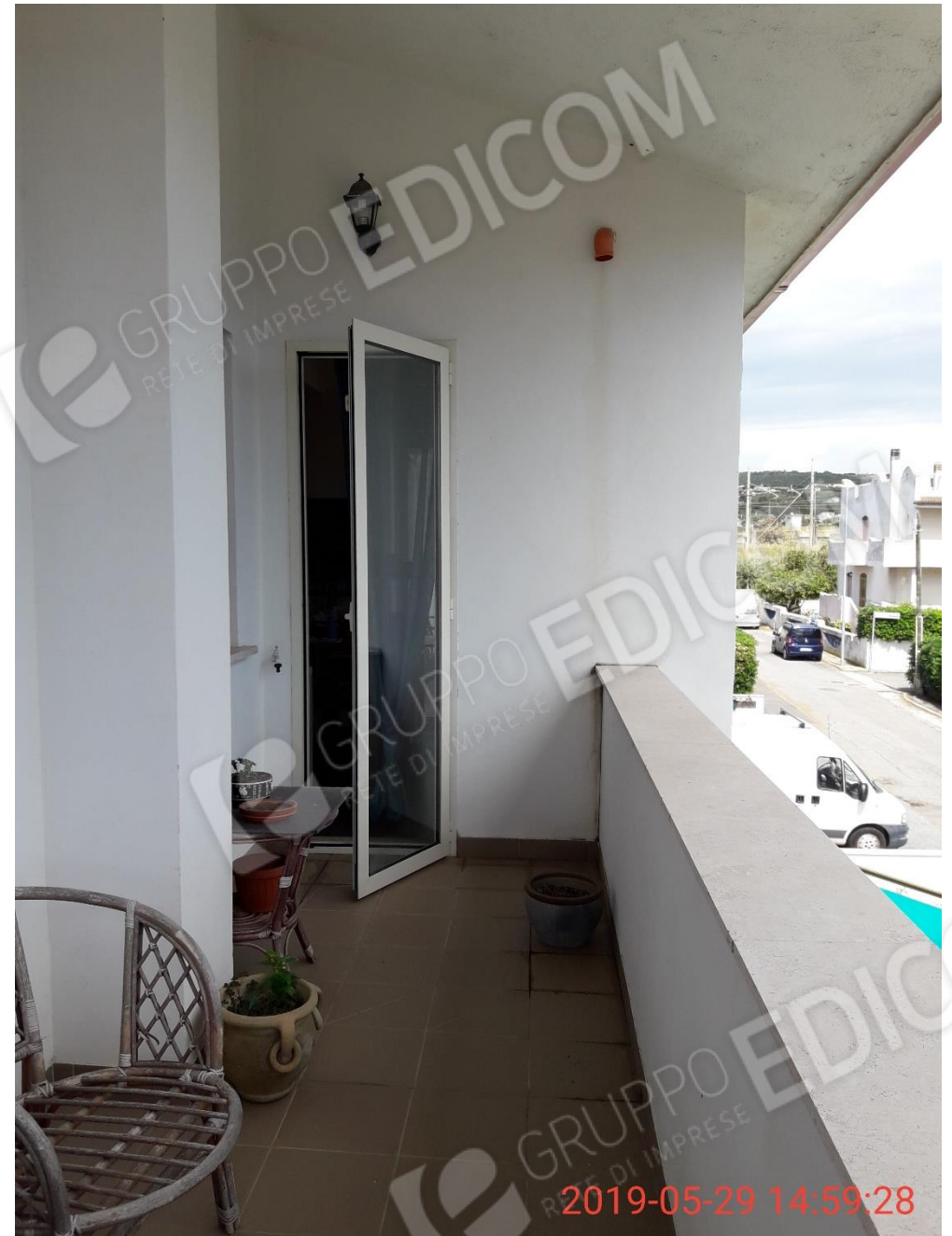
Figura 22 piano primo, balcone 5