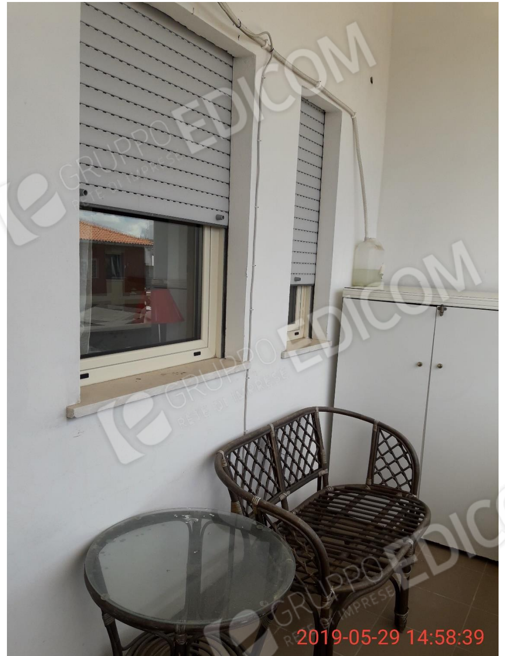
Figura 20 piano primo, balcone 4