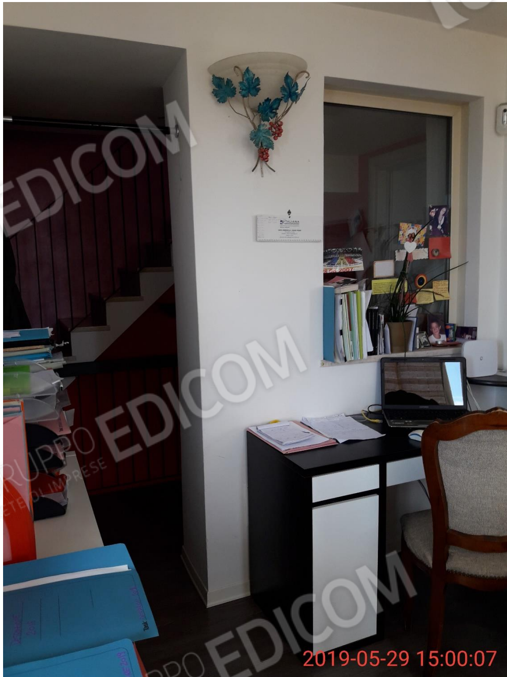
Figura 17 piano primo, veranda lato vano di collegamento con il corridoio