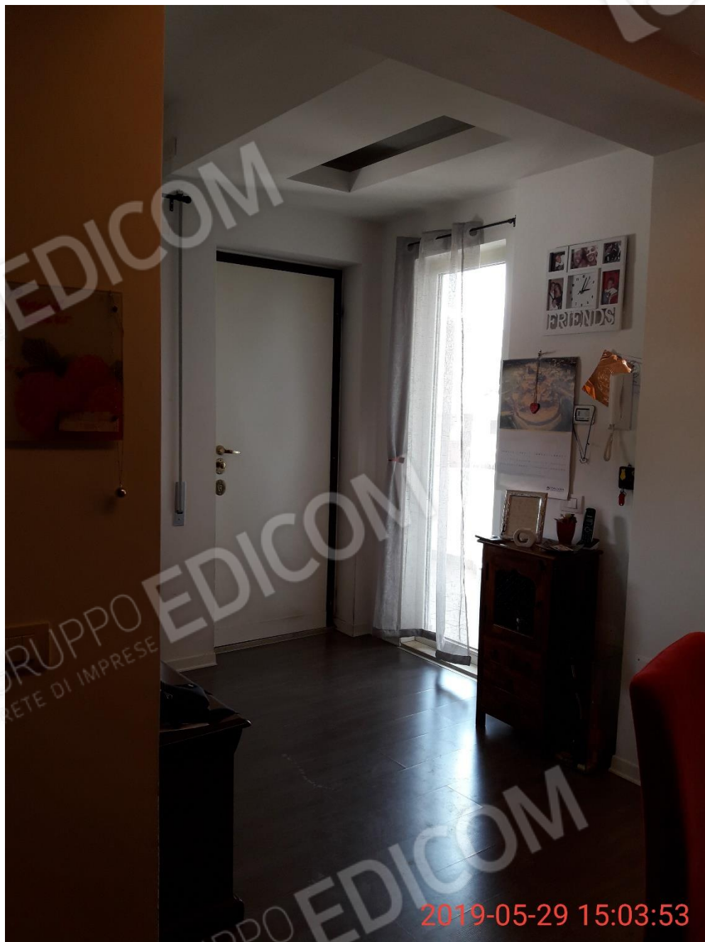
Figura 6 ambiente soggiorno/pranzo con angolo cottura