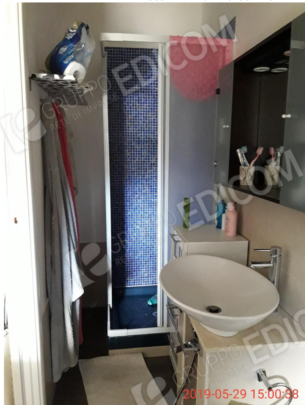
Figure 14 e 15 piano primo, camera da letto (L2) e bagno (B3)