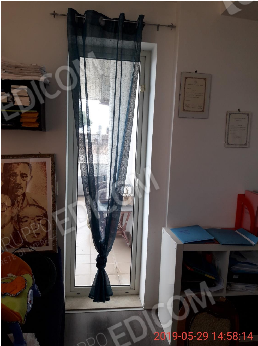
Figura 21 piano primo, veranda porta finestra verso il balcone 5