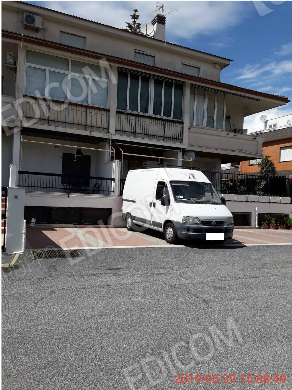
Figura 2 posto auto scoperto