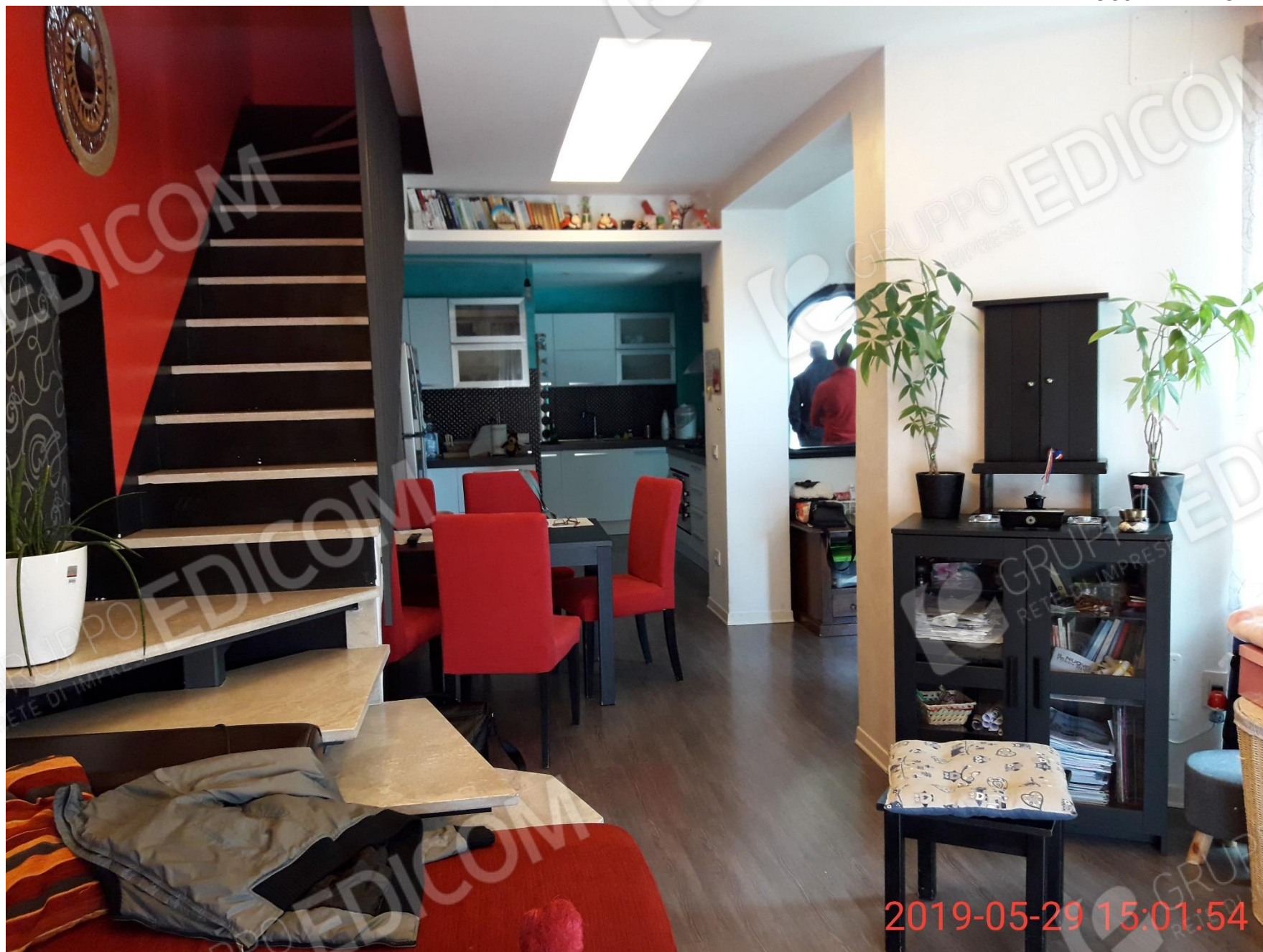
Figura 7 ambiente Soggiorno/Pranzo con angolo cottura