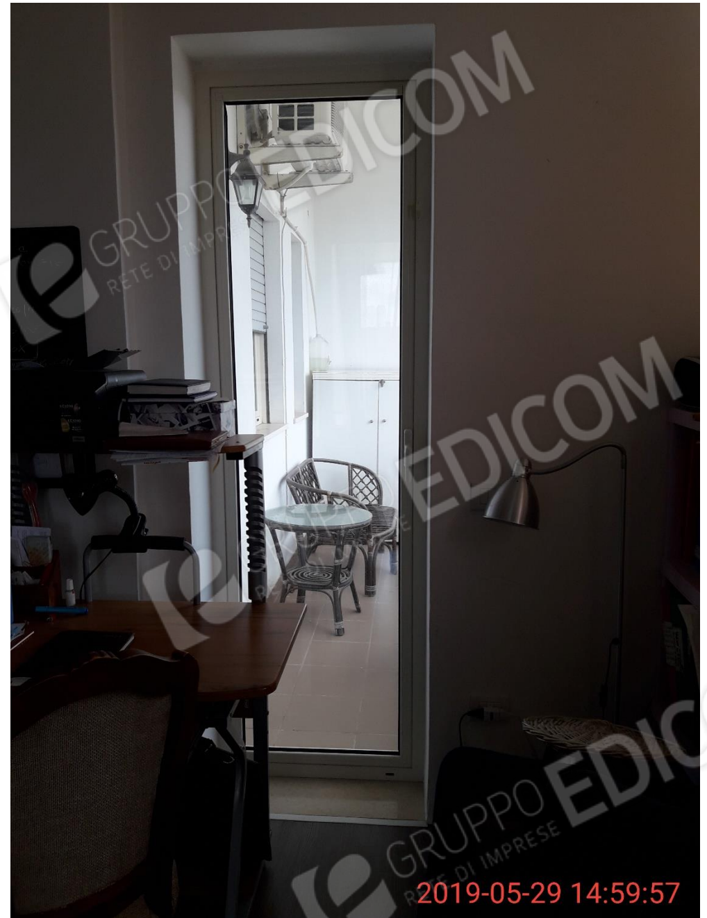
Figura 18 piano primo, veranda porta finestra verso il balcone 4