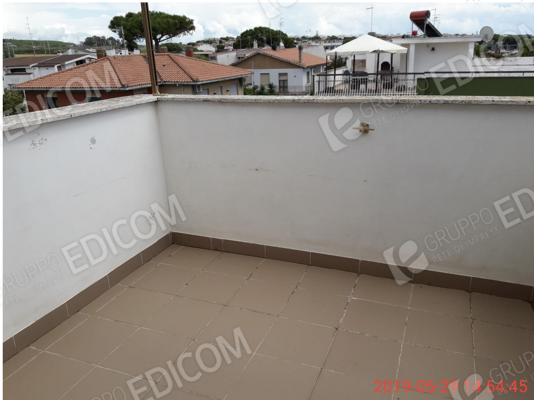
Figura 28 piano secondo, terrazza