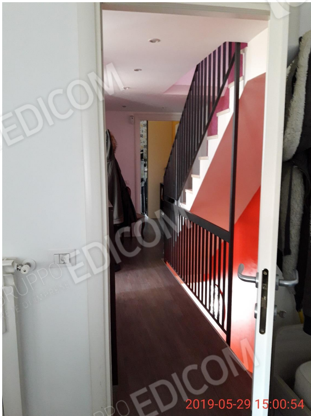
Figura 9 piano primo, corridoio/disimpegno