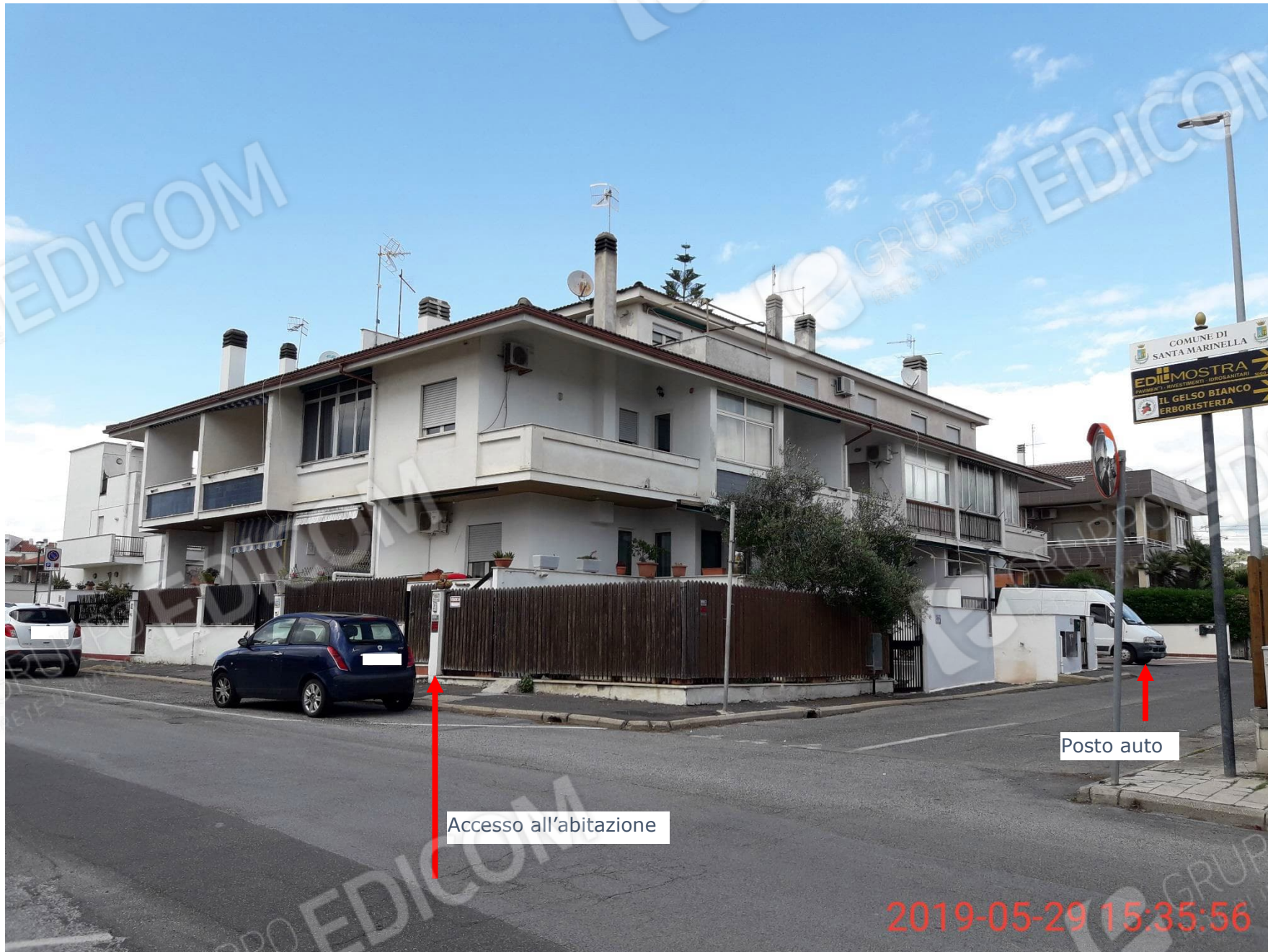
Figura 1 vista esterna dell'immobile di via Etruria n.100 e del posto auto scoperto