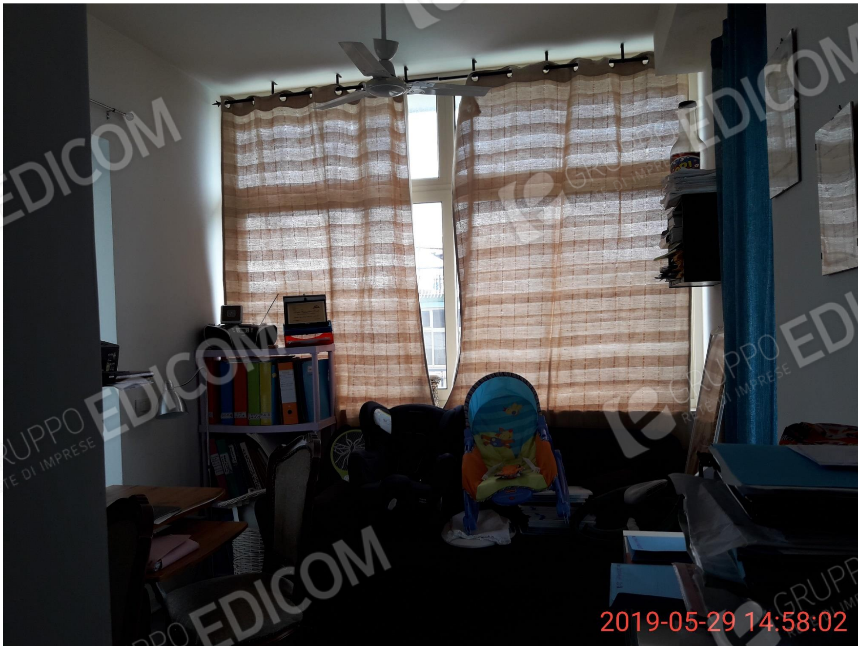
Figura 16 piano primo, veranda