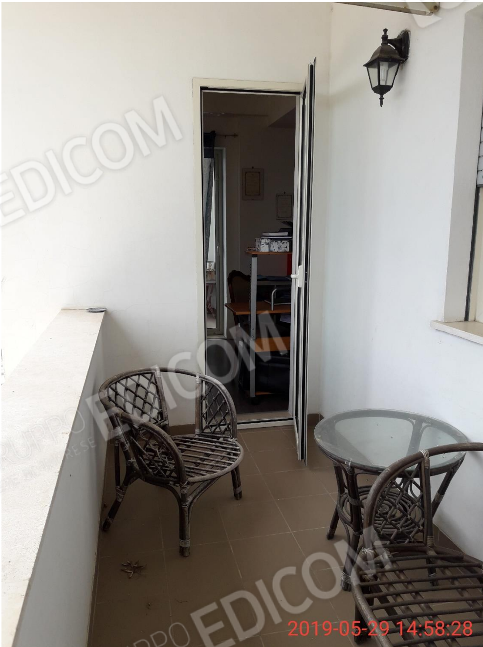
Figura 19 piano primo, balcone 4