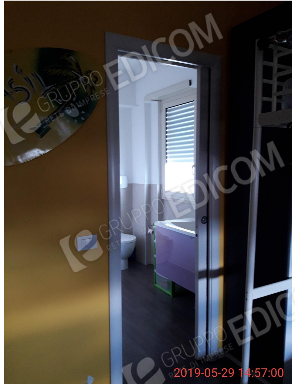
Figure 12 e 13 piano primo, bagno (B2) della camera da letto (L1)