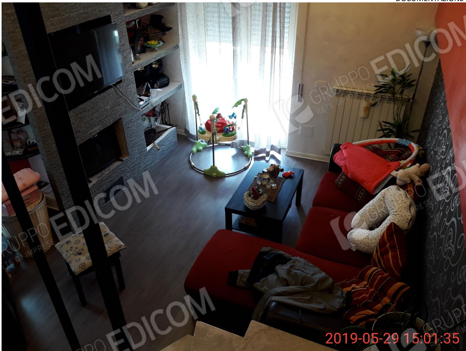
Figura 8 ambiente Soggiorno/Pranzo