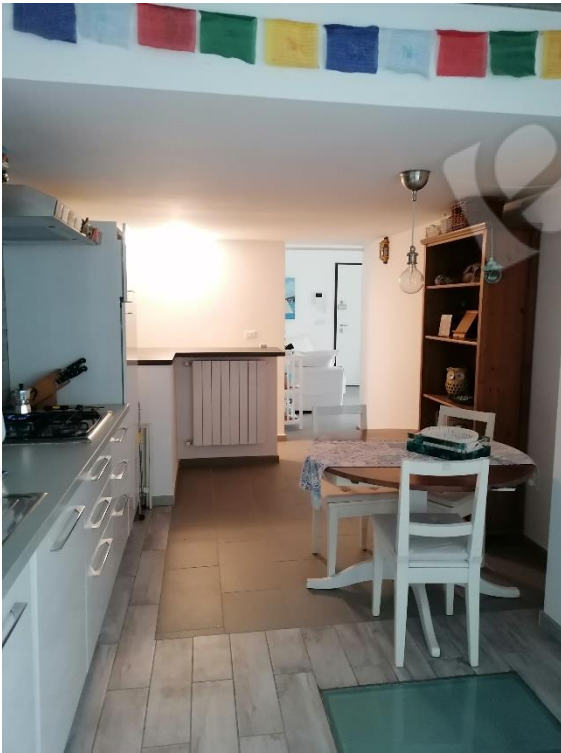
LOCALE CUCINA (servizi)