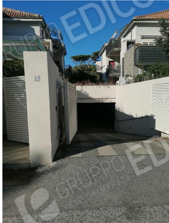
RAMPA ACCESSO AUTORIMESSA