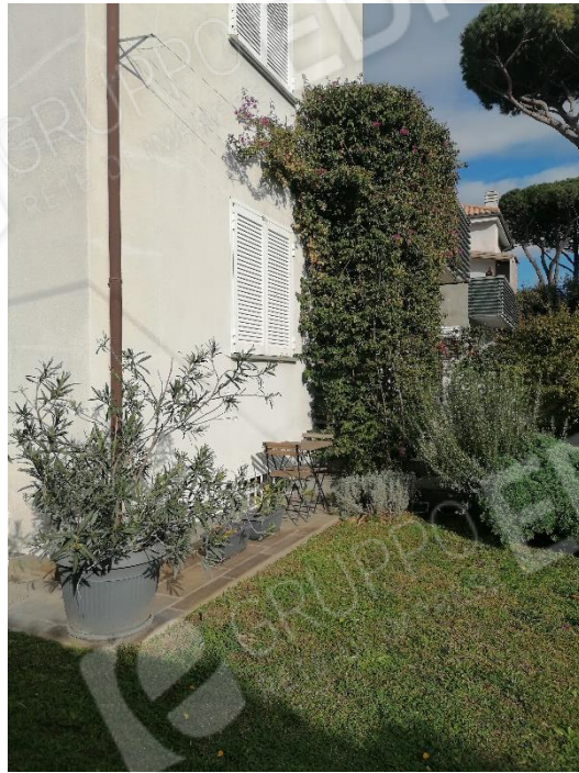
AREA ESTERNA ESCLUSIVA