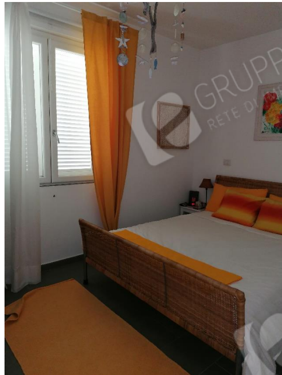
CAMERA 1 P.T.