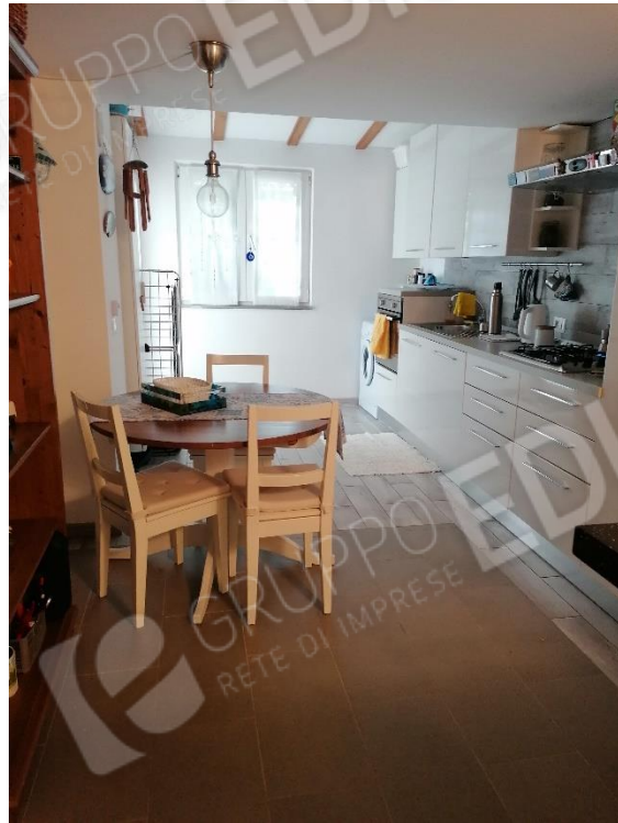
LOCALE CUCINA (servizi)