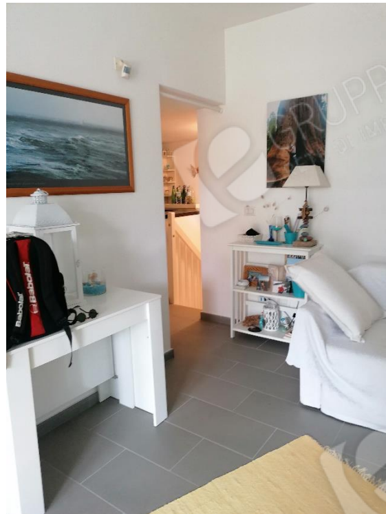
APERTURA VANO MURARIO