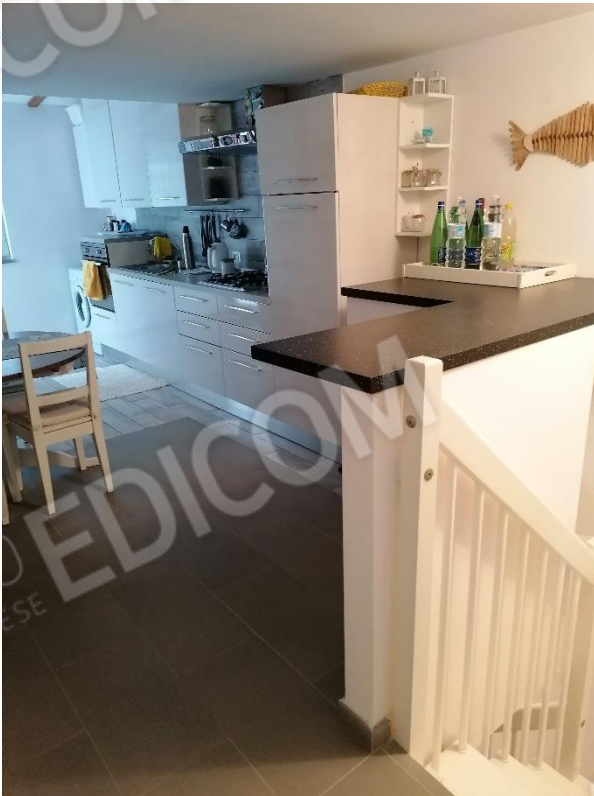
LOCALE CUCINA (servizi).