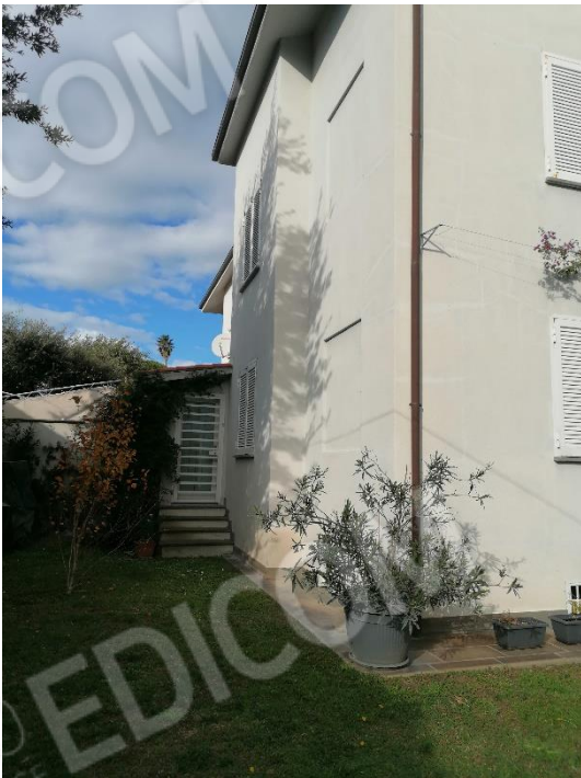
AREA ESTERNA ESCLUSIVA