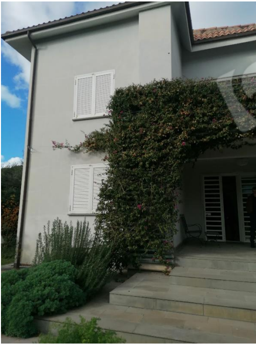
AREA ESTERNA ESCLUSIVA