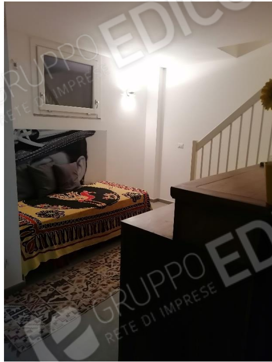
CAMERA P.S1 (cantina)