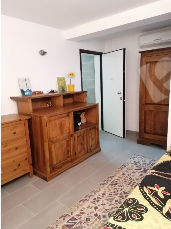
CAMERA P.S1 (cantina)