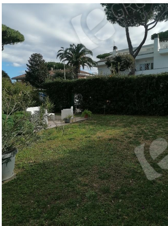
AREA ESTERNA ESCLUSIVA