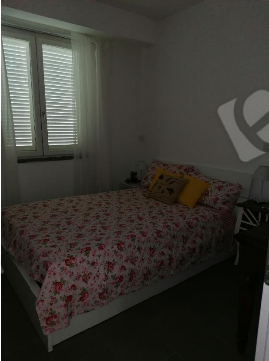
CAMERA 2 P.T.