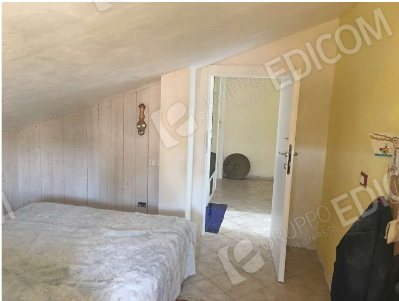
MANSARDA - CAMERA 2