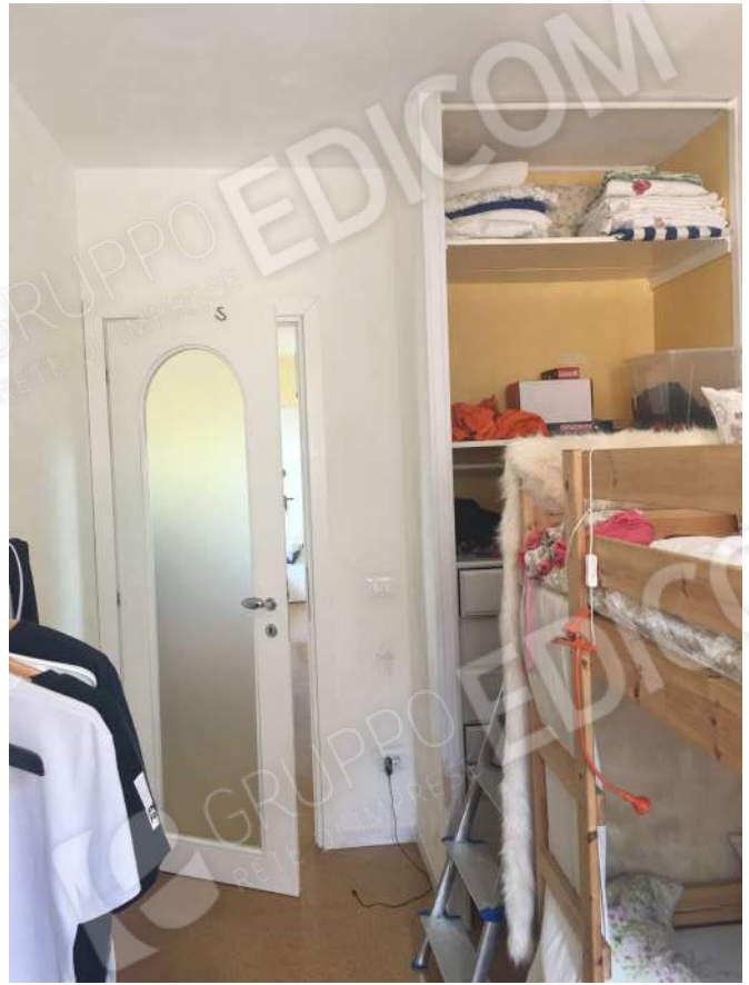
CAMERA E CAMERETTA PIANO PRIMO