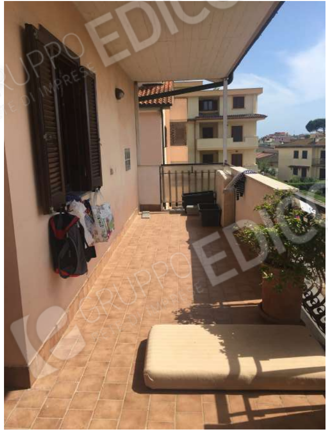
TERRAZZO PERIMETRALE CON LOCALE TECNICO