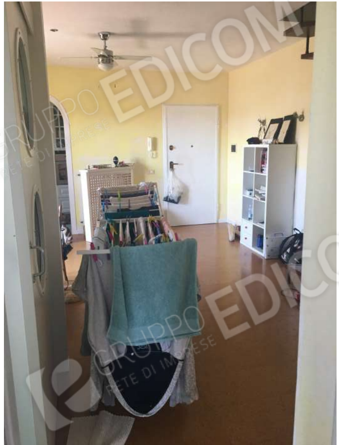
INGRESSO DELLO STABILE, SOGGIORNO E BAGNO