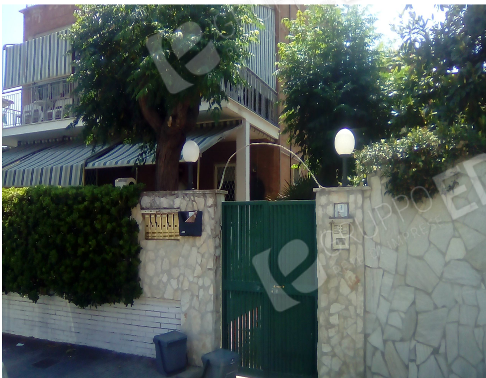
FOTO N. 4 - ingresso al piano terra dall'area condominiale -