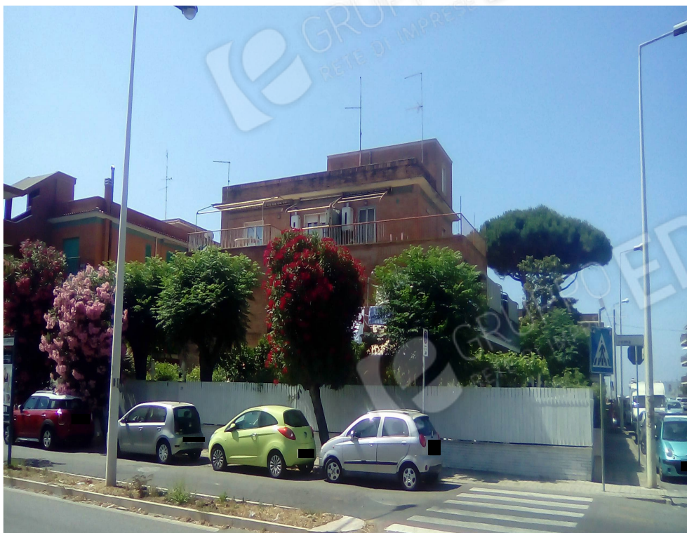
FOTO N. 2 Veduta esterna su via Bracciano