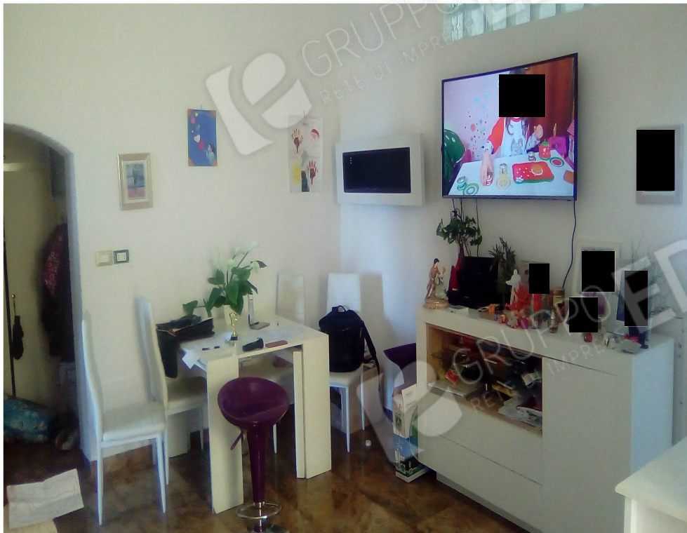
FOTO N. 8 - Soggiorno-