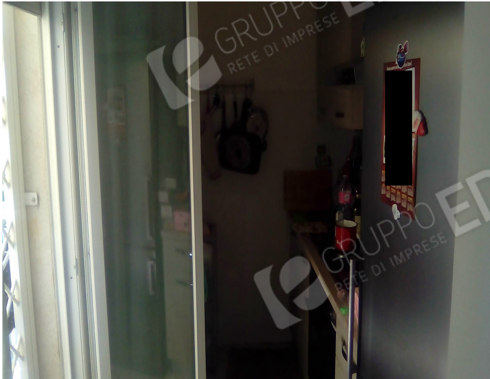
FOTO N. 12 Balcone