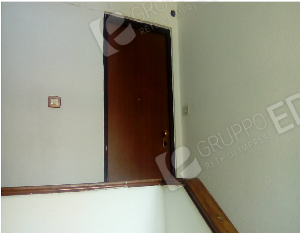
FOTO N. 6 Soggiorno