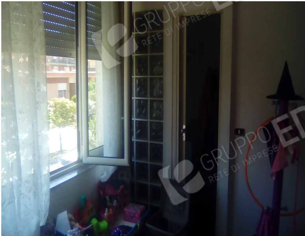
FOTO N. 10 - Camera da letto -