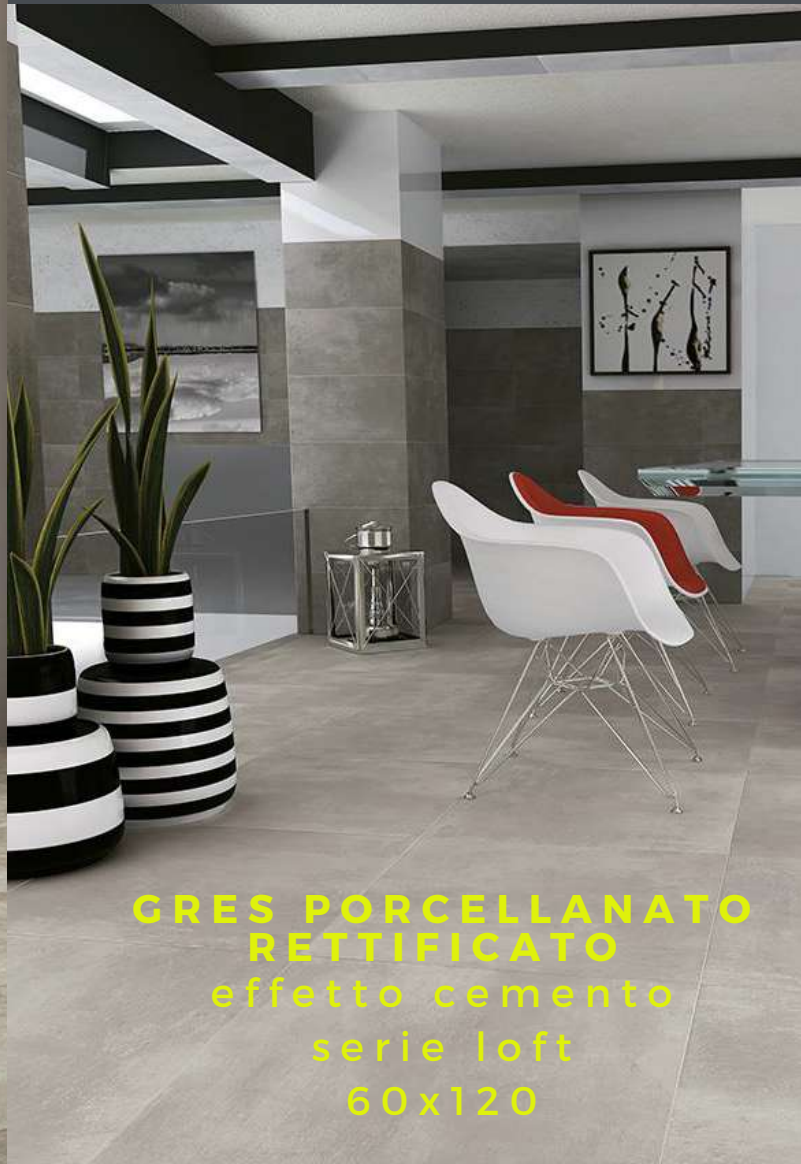
GRES PORCELLANATO RETTIFICATO effetto cemento serie loft 60x120