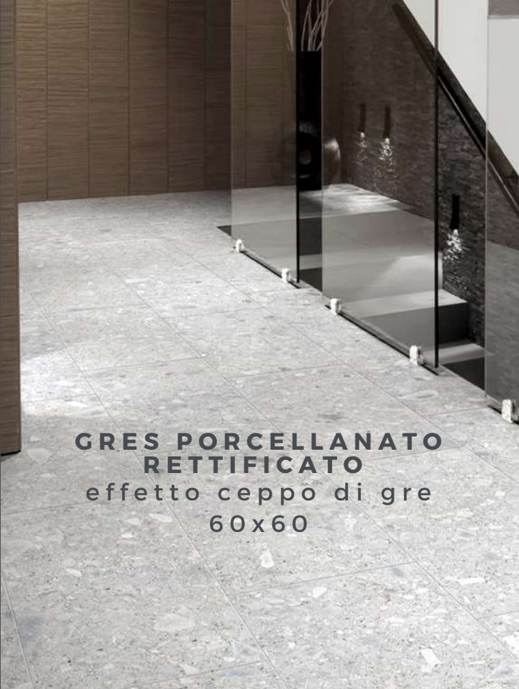
GRES PORCELLANATO RETTIFICATO effetto ceppo di gre 60x60