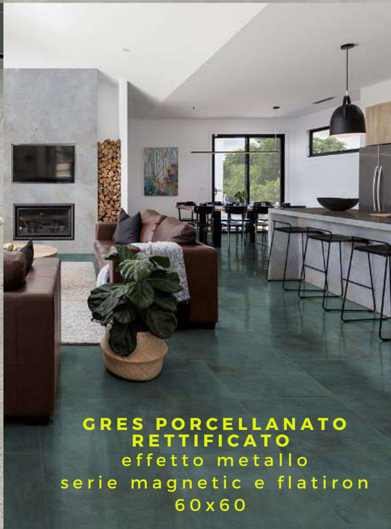
GRES PORCELLANATO RETTIFICATO effetto metallo serie magnetic e flatiron 60x60