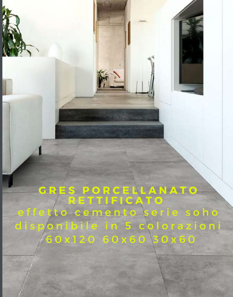
GRES PORCELLANATO RETTIFICATO effetto cemento serie soho disponibile in 5 colorazioni 60x120 60x60 30x60