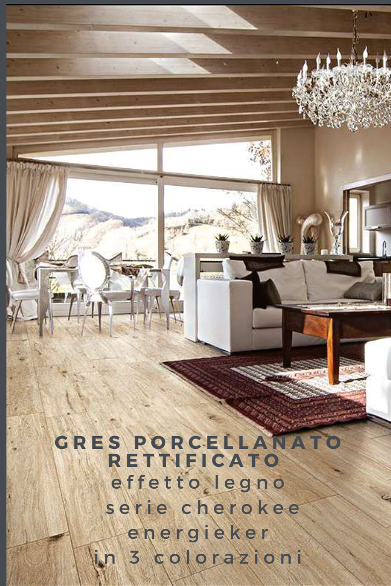
GRES PORCELLANATO RETTIFICATO effetto legno serie cherokee energiker in 3 colorazioni