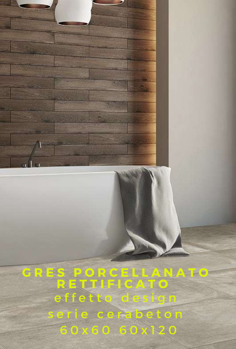
GRES PORCELLANATO RETTIFICATO effetto design serie cerabeton 60x60 60x120