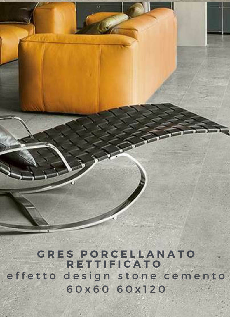
GRES PORCELLANATO RETTIFICATO effetto design stone cemento 60x60 60x120