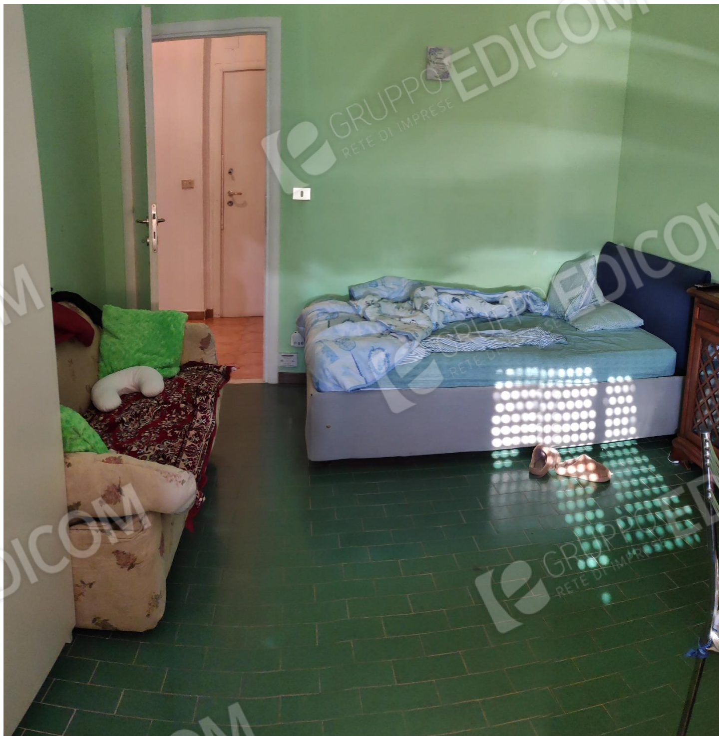
Figura 6 camera da letto 3