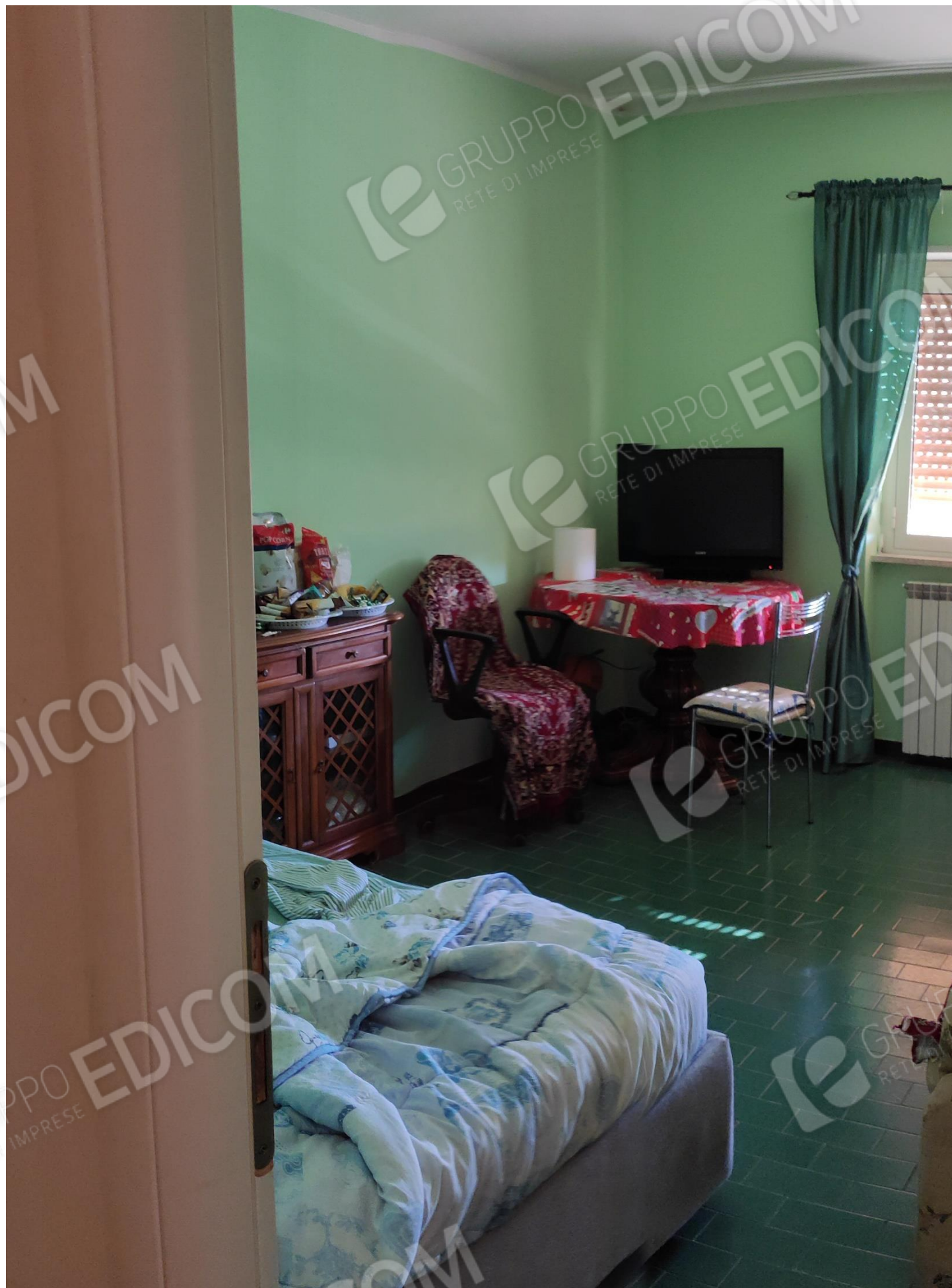
Figura 5 camera da letto 3