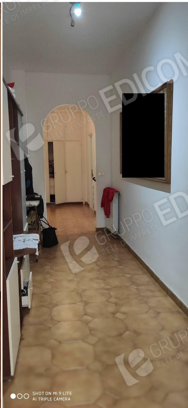
Figura 3 ambiente di ingresso e disimpegno