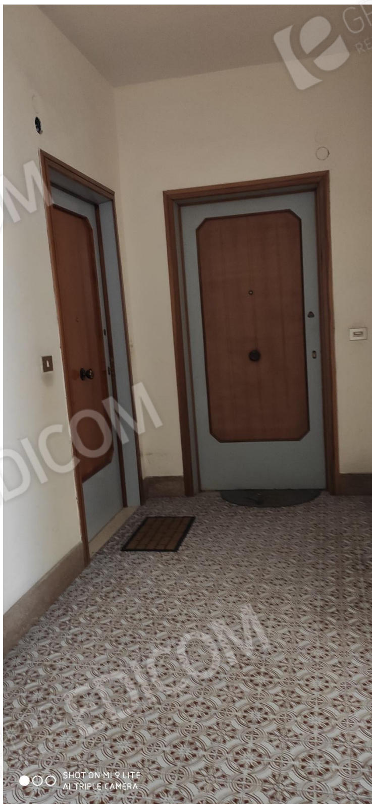
Figura 1 pianerottolo condominiale di accesso all'unità immobiliare