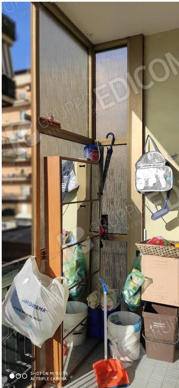
Figura 12 balcone con pareti vetrate