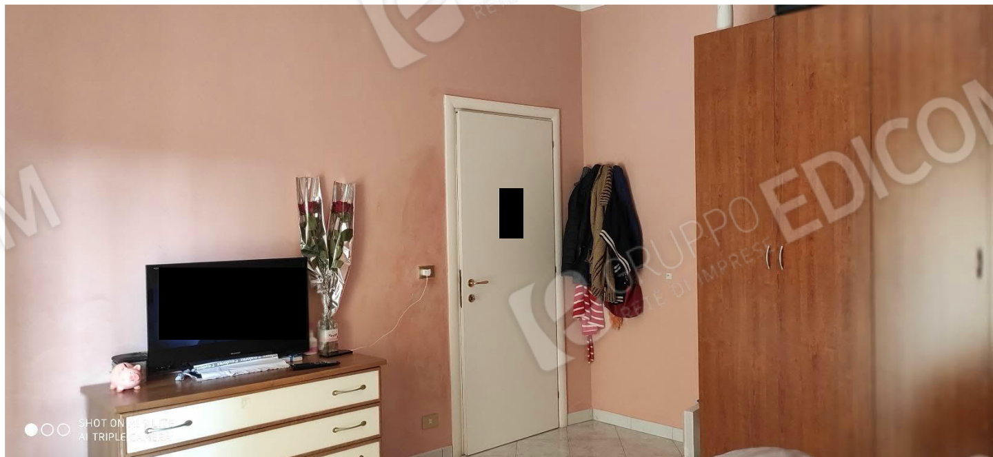
Figura 10 camera da letto 1