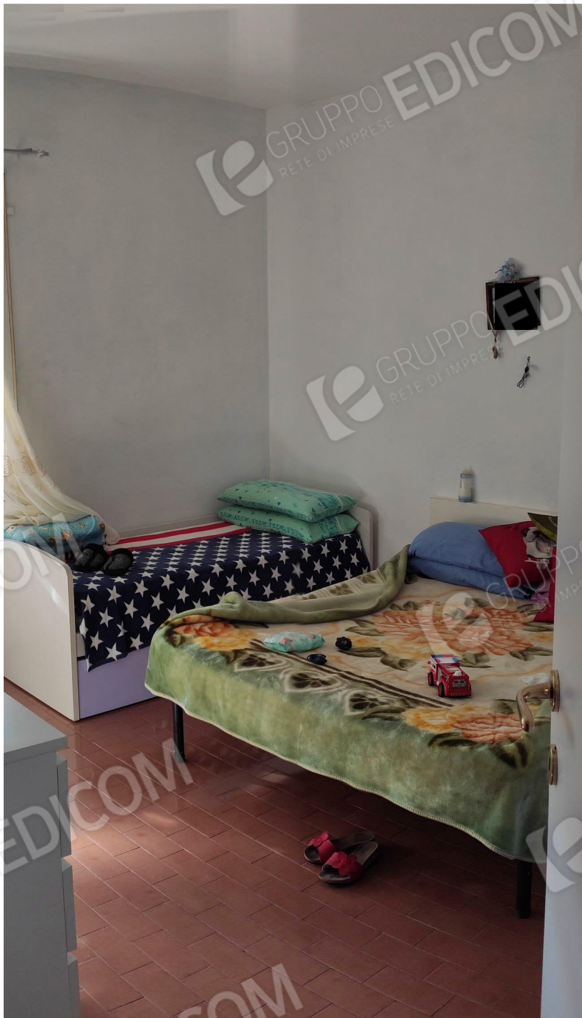
Figura 9 camera da letto 2