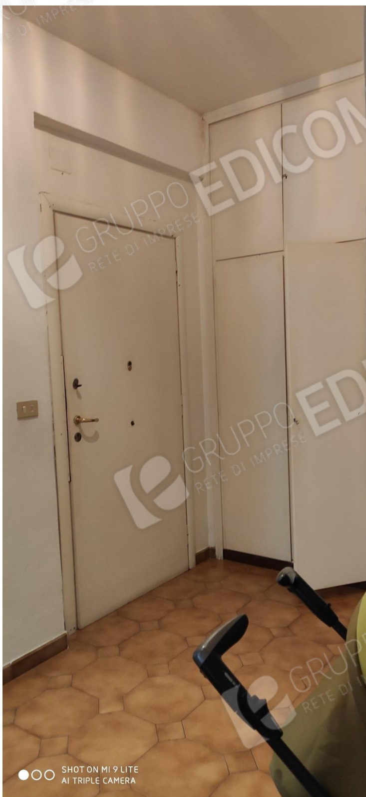
Figura 2 ambiente di ingresso