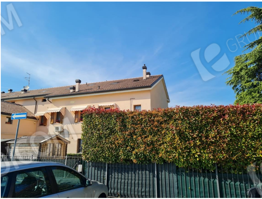
VISTA DA VIA GIOTTO