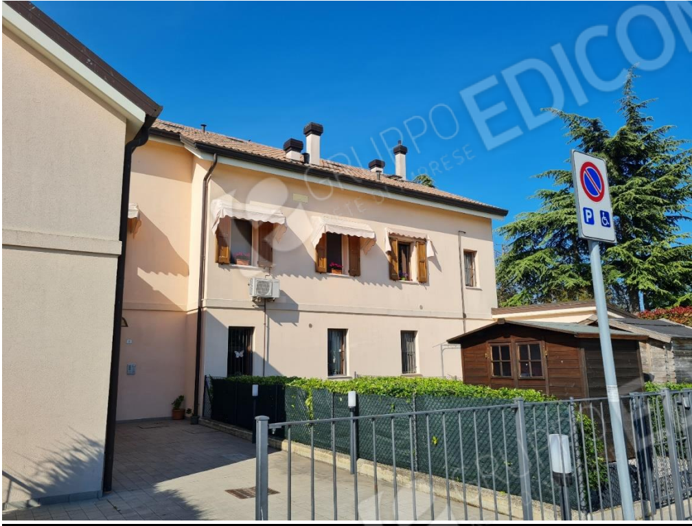
VISTA DA VIA GIOTTO