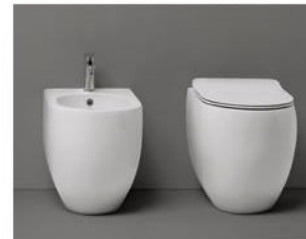
VASO e BIDET