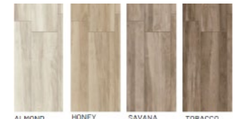
ALMOND HONEY SAVANA TOBACCO

Nei locali bagno, cucina e lavanderia (ove prevista a progetto), saranno fornite e posate a pavimento piastrelle in gres porcellanato a scelta tra: