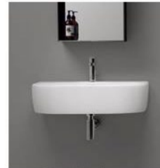
LAVABO Kerasan con foro centrale e sifone d'arredo a vista