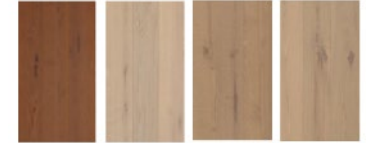
Raso Country Velo Country Tela Country Iuta Country

In alternativa, all'interno delle unità immobiliari potranno essere fornite e posate piastrelle in GRES EFFETTO LEGNO di dimensioni indicative 20x120