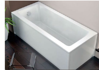
VASCA Ideal Standard