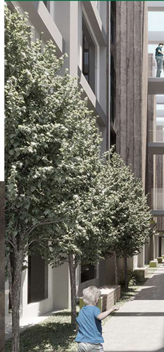
< Particolare della Corte