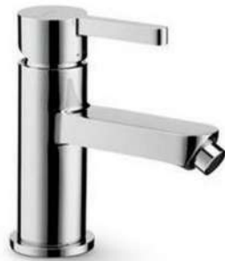
Mod. Fantasia Prod. Pozzi Ginori