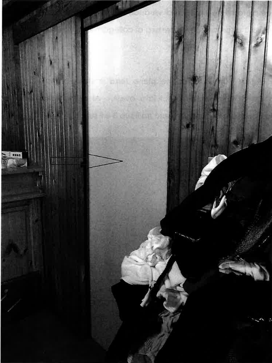
part. Tamponamento porta collegamento tra sub 2 e 3