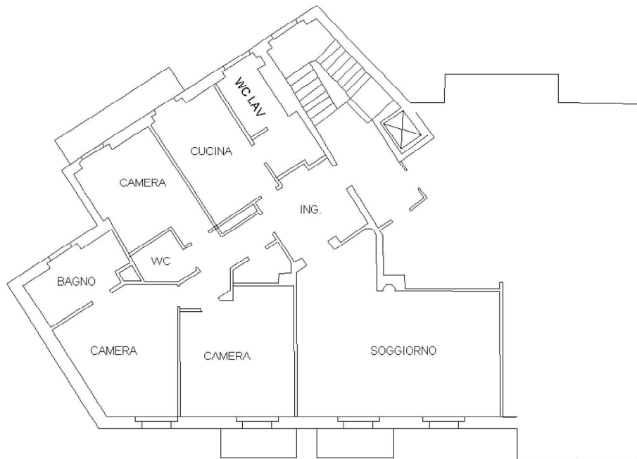
PIANTA PIANO SESTO